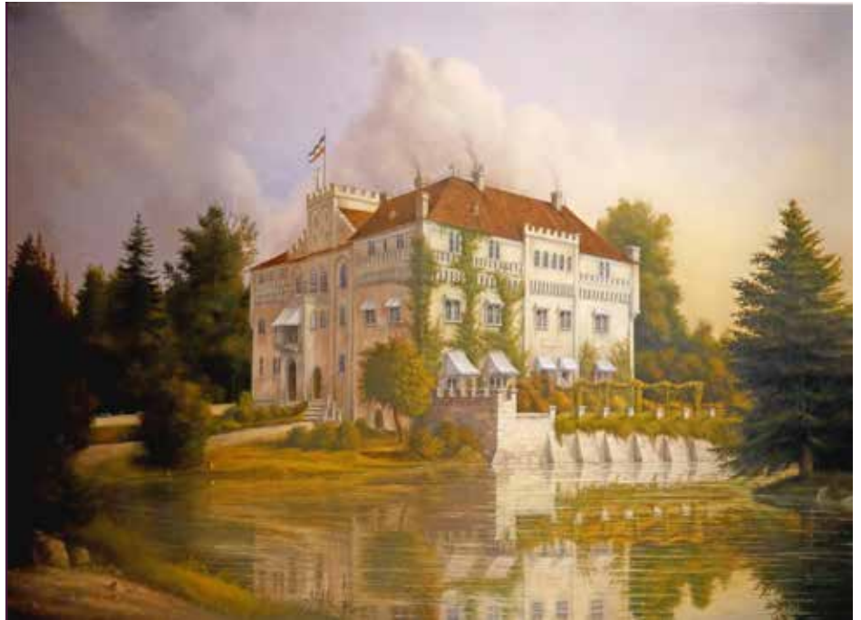
Das fertige Bild im Januar 2021

Nach der Armee ergriff Schwenke den Beruf eines Kochs. „Das ist auch ein sehr kreativer Beruf, bei dem die richtigen Zutaten eine enorme Rolle spielen.“ Schloss Weesenstein ist für ihn persönlich ein sehr wichtiger Ort, weil er dort 1976 geheiratet hatte. Während der Jahrhundertflut malte er das Schloss, um dem Ort wieder Hoffnung zu geben, und schenkte es der örtlichen Gaststätte. Daraufhin kamen viele Aufträge und er malte allein Schloss Weesenstein etwa 15 Mal. Aufträge für weitere Schlösser folgten. „Als Autodidakt habe ich mich bei jedem der Bilder weiterentwickelt und konnte selber sehen, wie sich Technik und Wirkung immer stärker perfektionierten“, resümiert Schwenke.