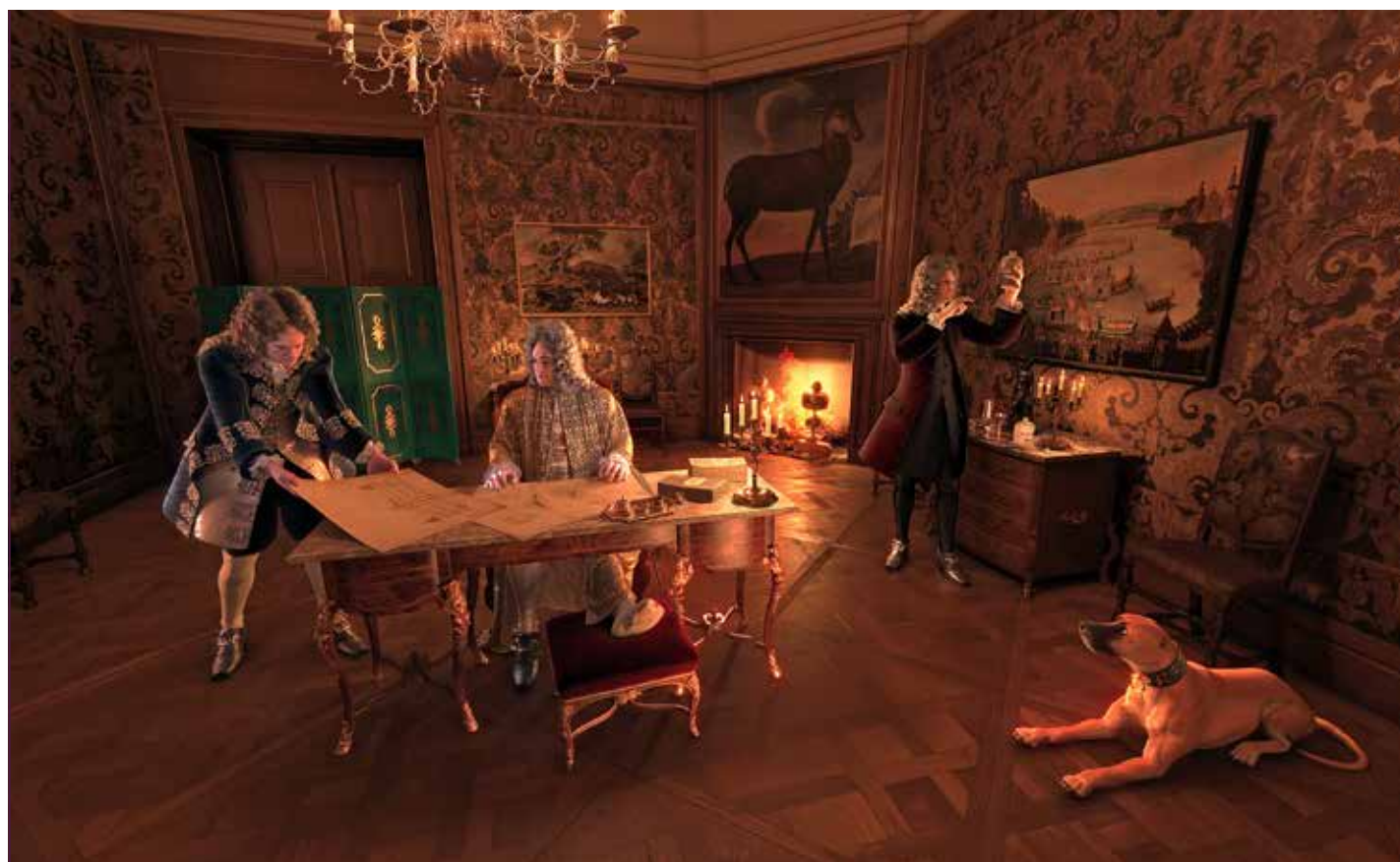
So privat erlebt man August den Starken selten: im Hauskleid am Schreibtisch

Den HistoPad-Rundgang komplettieren wissenswerte Informationen über die Ausstattung der Räume und bedeutende Sammlungsobjekte, zum Beispiel das berühmte Federzimmer oder die Goldledertapeten. Kurzweilige Filme bieten einen Ausblick auf die umliegende Moritzburger Kulturlandschaft, die untrennbar mit dem Schloss verbunden ist und