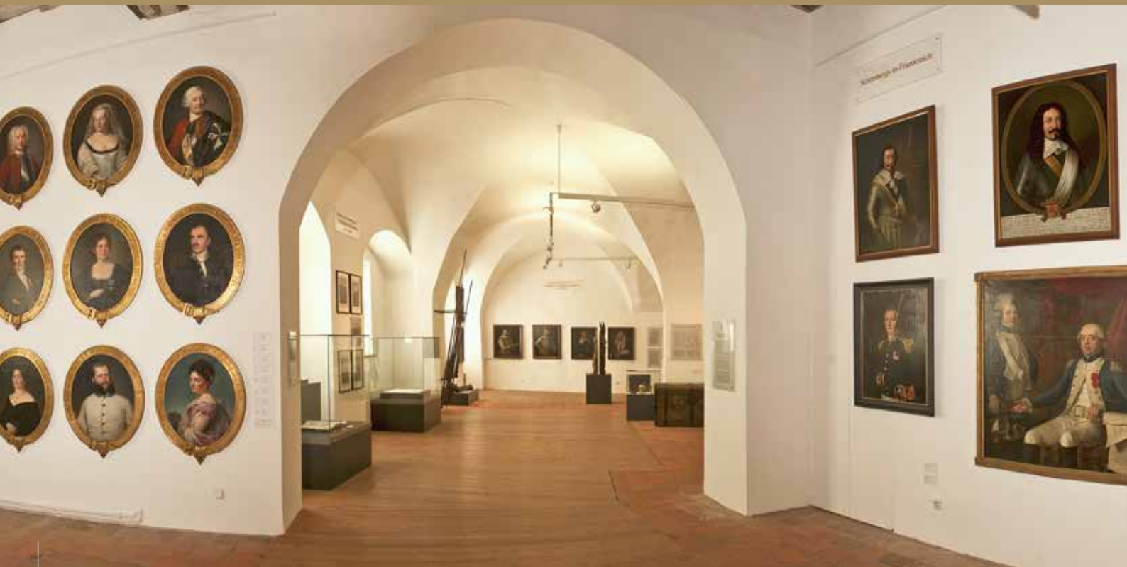
Die Dauerausstellung zur Familie von Schönberg im Schloss Nossen besteht größtenteils aus Kunstwerken der von Schönberg'schen Stiftung.