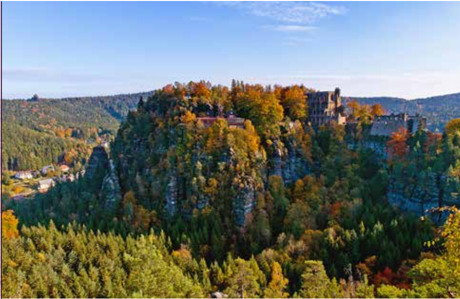
Burg und Kloster Oybin

birge und der Görlitzer Altstadt erkundet werden. Daneben locken auch Zittauer-, Iser- und Riesengebirge zum Wandern oder der Berzdorfer See zu einer Abkühlung ein. St. Marienthal ist Teil der „Via sacra“, einer Kulturroute im Dreiländerdreieck, die 20 sakrale Sehenswürdigkeiten miteinander verbindet.