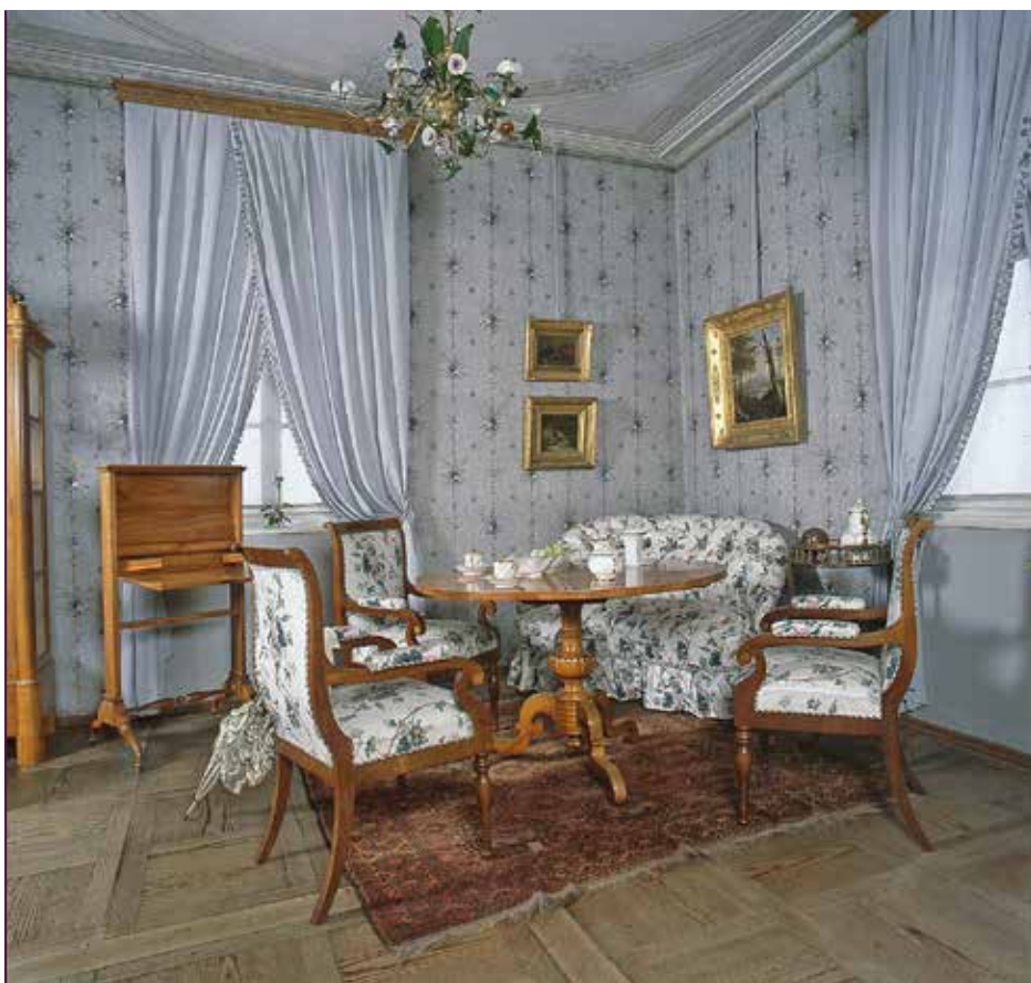
Wohnzimmer der Königin Amalie Auguste im Schloss Weesenstein

Das Goldene Hochzeitsjubiläum Johanns und Amalie Augustes 1872 bildete einen weiteren Höhepunkt in ihrem Leben. Zugleich war es aber auch ein gesellschaftliches Ereignis ersten Ranges, bei dem das königliche Paar, das Königshaus und die Monarchie in der Öffentlichkeit verherrlicht wurden. Mehrtägige Feierlichkeiten mit der Einsegnung des