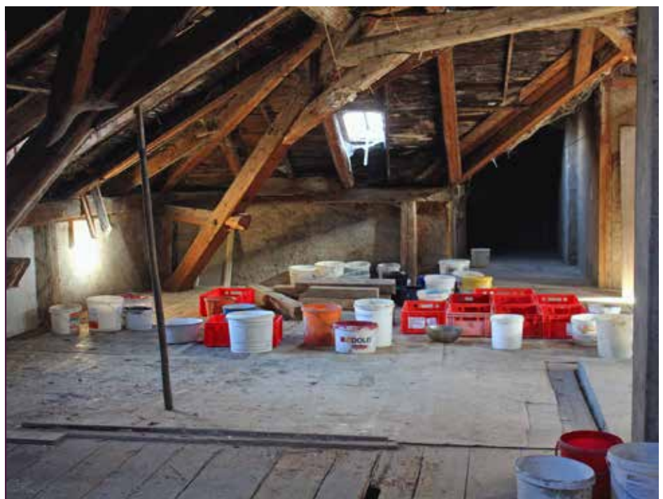
Wenn es regnet, fangen zahllose Eimer das Wasser auf, das durch die undichte Dachdeckung tröpfelt

Das Gebäude, das in seiner heutigen Form nach einem Brand 1872 im klassizistischen Stil erbaut wurde und um 1900 mit einem zentralen Turm und Seitenbauten versehen wurde, basiert auf einem alten Herrensitz, der verschiedenen Adelsfamilien gehörte. Dazu zählen u. a. die Familien