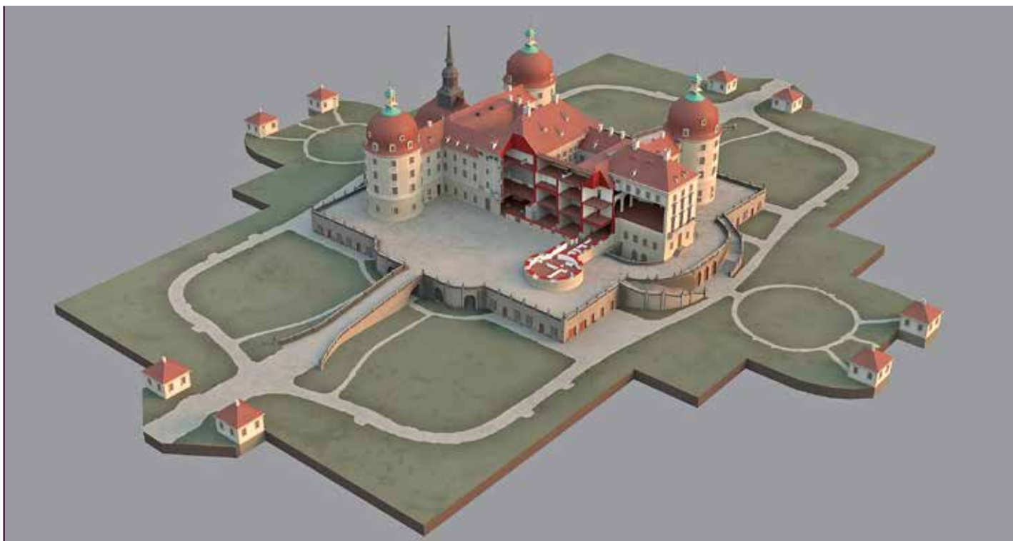
Interaktives Modell von Schloss Moritzburg

sich im Anschluss an einen Schlossbesuch wunderbar erkunden lässt. Und auch die bauliche Genese des Barockschlosses aus einem Renaissance-Vorgängerbau kommt nicht zu kurz. Für Spaß bei Groß und Klein sorgt darüber hinaus eine digitale Schatzsuche.