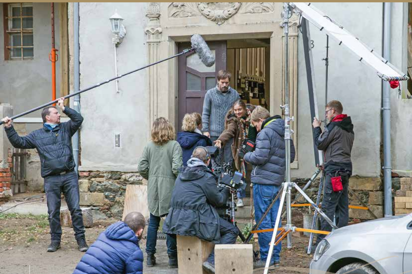
Schloss Pinnewitz während der Dreharbeiten für „Parasomnia“. Der Film kann noch bis 15. Mai 2021 in der ARD-Mediathek abgerufen werden.