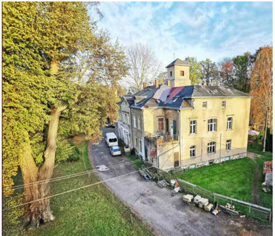
Schloss Pinnewitz hat in den letzten 80 Jahren stark gelitten. Dach und Fassaden benötigen eine Erneuerung.