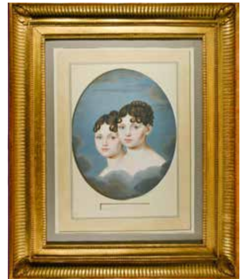
Amalie Auguste und Elisabeth Ludovica von Bayern, Gesamtansicht des Pastells, um 1810

Als im Jahr 1838 nach dem Tod seines Vaters Prinz Maximilians Weesenstein in den Besitz Prinz Johanns übergang, wurde das im Müglitztal gelegene Schloss sein und sicher auch Amalie Augustes Lieblingsitz. Der Prinz besichtigte alsbald das Rittergut mit den „drei Oeconomien Meusegast, Burkertswalde und Biensdorf“ und begab sich danach ins Schloss, „wo eben meine Frau, gleichfalls im Schlitten, ankam.“ – eine herrliche Vorstellung! Zahlreiche Möbel und Ausstattungsgegenstände aus dem Besitz der königlichen Familie haben sich bis heute erhalten. Am Ende des dorfseitigen Flügels des Unterschlosses befindet sich das ehemalige Appartement Amalie Augustes. Im Anschluss an den Wohnbereich Johanns gelegen, umfasste es das Empfangszimmer, das gemeinsame Schlafzimmer mit dem Betkabinett, das Ankleidezimmer oder Toilettenkabinett, das Wohnzimmer und die Zofenkammer.