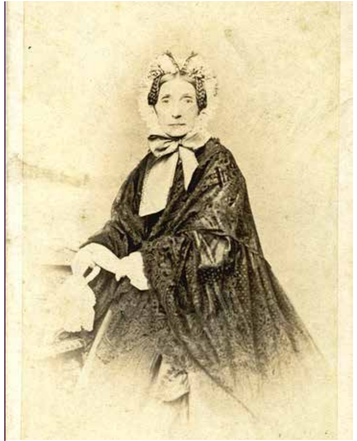
Königin Amalie Auguste von Sachsen, Visitenkarte, um 1860

aber ich fühle schon recht die Schwächen und Gebrechen des Alters. Es ist ein peinliches Gefühl, wenn nach und nach die Kräfte abnehmen.“ Auch nach dem Tod ihres Mannes lebte Amalie Auguste im Winter in Dresden und während der warmen Jahreszeit in Pillnitz, teilweise auch in Jahnishausen. Weesenstein war in den Besitz ihres Sohnes Georg übergegangen.