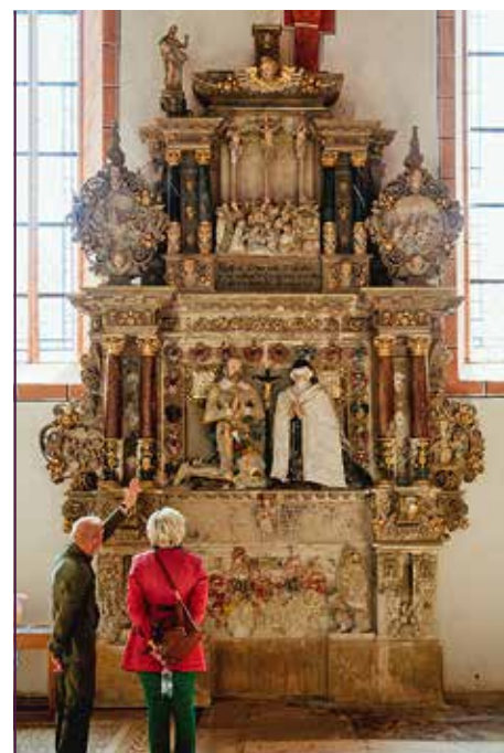
Epitaph für Caspar von Schönberg auf Purschenstein und seine Ehefrauen in der Stadtkirche in Sayda, restauriert mit Stiftungsmitteln

Über die Jahre wurden insbesondere von den Staatlichen Kunstsammlungen Dresden, dem Stadt- und Bergbaumuseum Freiberg und dem Museum in Dippoldiswalde über 120 Exponate restituiert. Alle wurden in die neue Stiftung überführt und durch diese teilweise restauriert. 1998 gab es eine erste Ausstellung im Stadt- und Bergbaumuseum in Freiberg. Seit 2004 zeigen die Staatlichen Schlösser, Burgen und Gärten Sachsen auf Schloss Nossen die Exponate in einer Dauerausstellung zur Familie von Schönberg. Parallel wurden von 2010 bis 2017 in acht Sonderausstellungen verschiedene Themen zum sächsischen Adel beleuchtet und durch Exponate von Mitgliedern des sächsischen Adels und der von Schönberg'schen Stiftung bereichert. Diese Sonderausstellungen sollten einen Vorgesmack auf die im Südflügel von Schloss Nossen geplante Dauerausstellung zur Geschichte des sächsischen Adels bieten. Die Baumaßnahmen im Südflügel haben begonnen und an dem sehr innovativen Ausstellungskonzept wird unter Leitung der Staatlichen Schlösser, Burgen und Gärten Sachsen gearbeitet. Die Gründung der Stiftung wurde nur durch die finanzi-