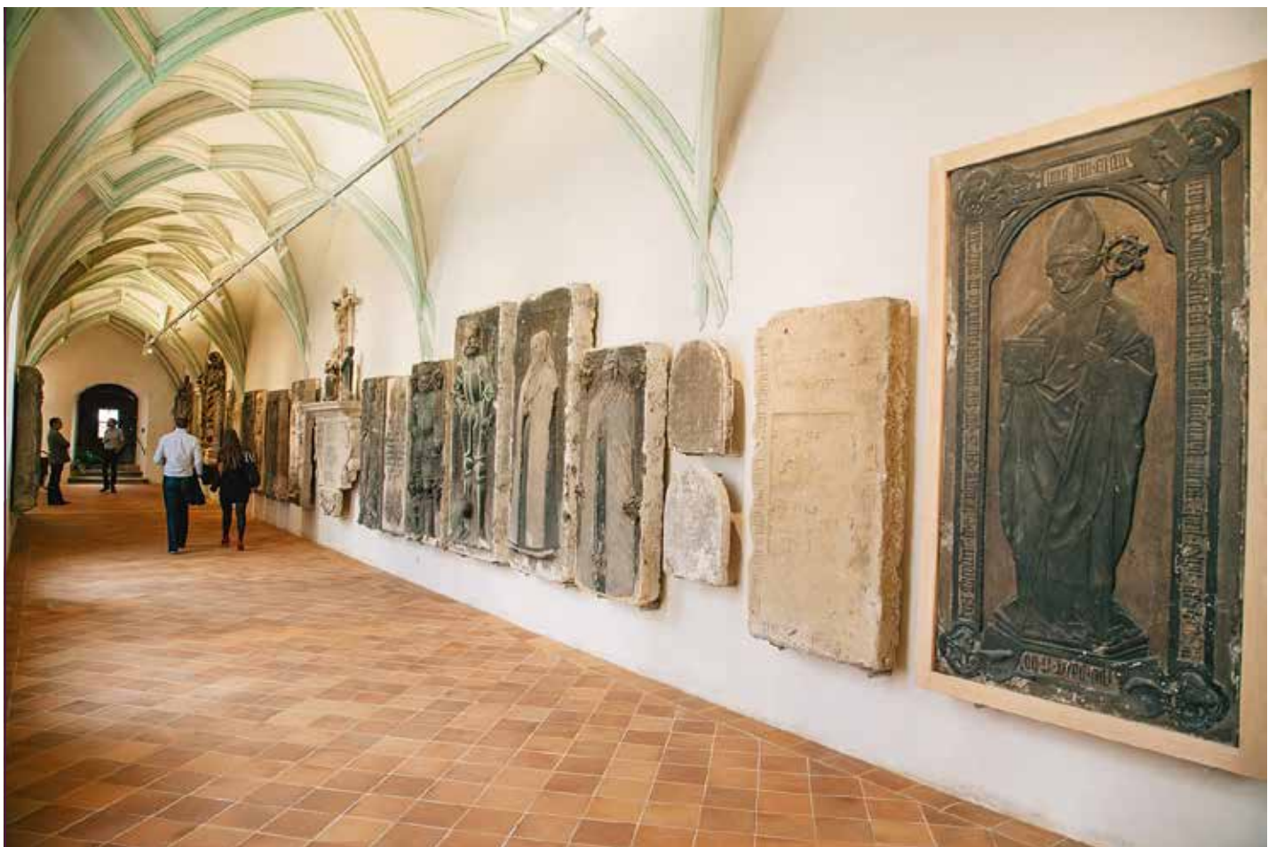
Der wiederhergestellte Kreuzgang des Freiburger Doms (oben und unten) mit Schönberg'schen Grabdenkmälern