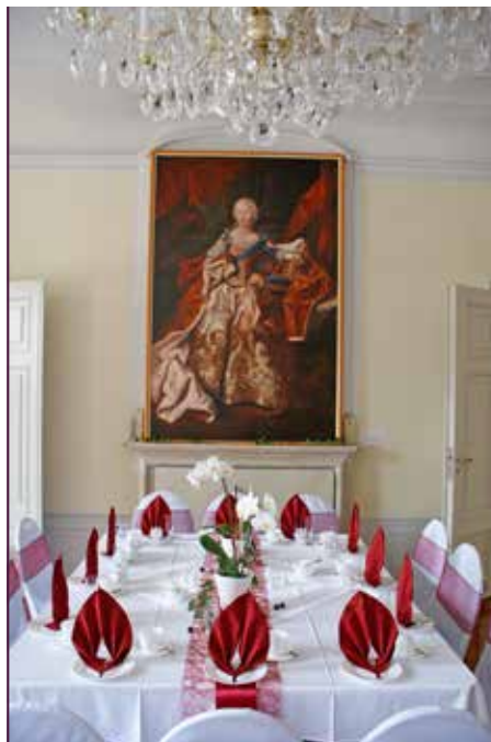
Eines der Gemälde für den Festsaal von Schloss Lauterbach

Die Kurse gaben dem Hobbymler enorme Impulse, und es entstanden unterschiedlichste Werke: „Da ich ein Fan von Maite Kelly bin, deren CDs ich beim Malen immer höre, habe ich auch ein Porträt von ihr gemalt und es ihr geschenkt.“