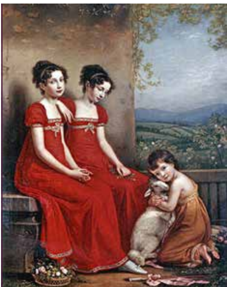
Elisabeth, Amalie und Maximiliane von Bayern, Ölgemälde von Joseph Karl Stieler, 1814