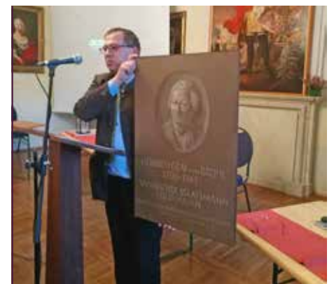
Der Vorsitzende mit einem Entwurf für die Brühl-Gedenktafel

Der Freundeskreis Schlösserland Sachsen, der Landesverein Sächsischer Heimatschutz und die Landesgruppe Sachsen der Deutschen Burgenvereinigung sind sich einig, eine „Interessengemeinschaft Sächsische Schlösser“ zu bilden. Das soll ein informeller Zusammenschluss sein, ohne Satzung oder Vereinsgründung, aber mit gemeinsamen Grundsätzen. Wie diese aussehen, ist noch zu vereinbaren. Die Corona-Pandemie hat leider die weitere Ausarbeitung der Vereinbarung verhindert. Die Vereine wünschen sich, dass auch das Landesamt für Denkmalpflege Sachsen und die Staatlichen Schlösser, Burgen und Gärten Sachsen an diesem informellen Zusammenschluss teilnehmen. Die Interessengemeinschaft soll sich bei Fragen von landesweiter Bedeutung zu Wort melden. Wenn die Vereine und Institutionen ihre Kräfte bündeln, so die Hoffnung, können sie im politischen Raum stärker wahrgenommen und gehört werden.