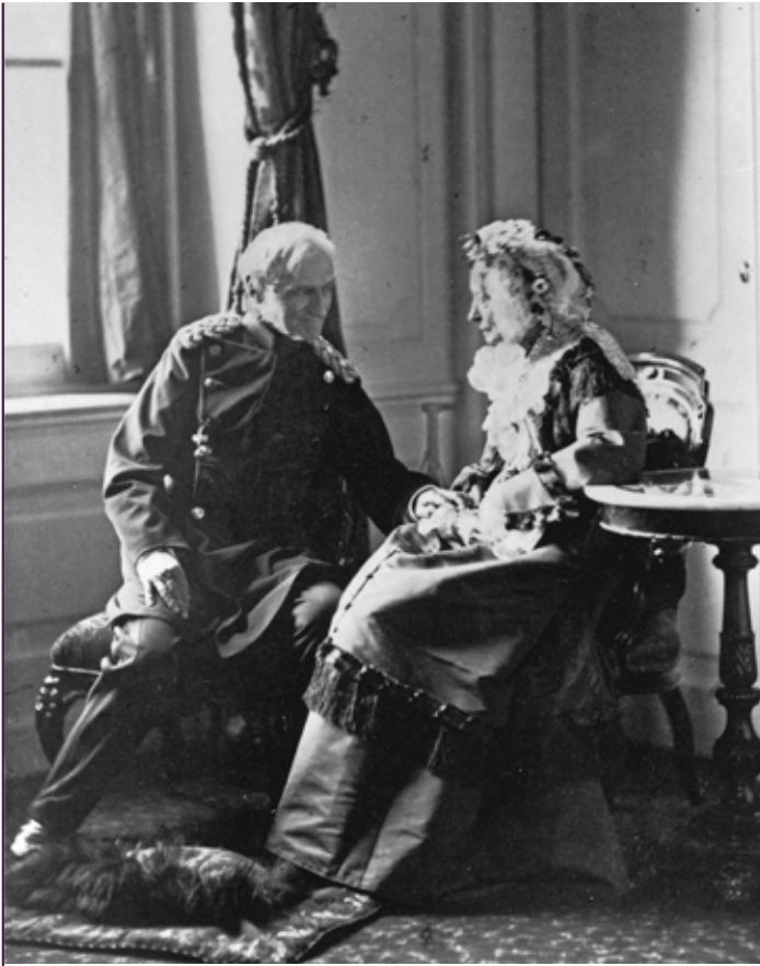
Königin Amalie Auguste und König Johann von Sachsen, 1872