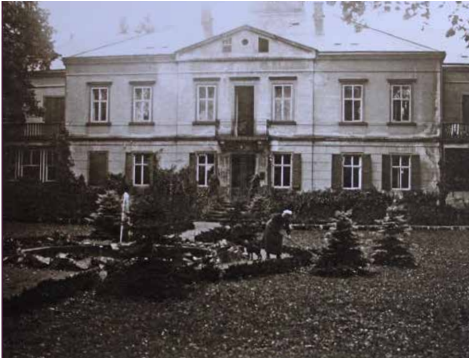
Historische Aufnahme des Schlosses, um 1900

zen von Sachsen. „So ergeben sich ideale Bedingungen für nationale und internationale Besucher, Gäste oder Mieter.“ Teilweise kommen auch die sogenannten „digital nomads“, die von jedem Ort aus arbeiten können und meist die Idylle mit guter Internetanbindung suchen.