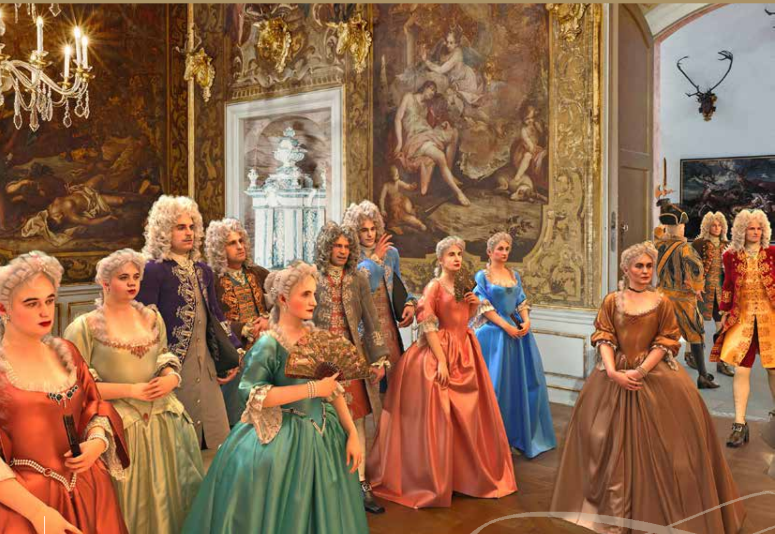
Im Monströsensaal versammelt sich 1728 die exklusive Festgesellschaft