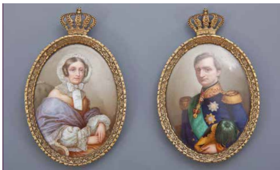
Medaillons mit den Bildnissen von Prinz Johann und Prinzessin Amalie Auguste von Sachsen, Malerei auf Porzellan, um 1850

Ein Foto zeigt Amalie Auguste als würdevolle alte Frau mit der für sie in späteren Lebensjahren typischen Haube. Etwa ein Jahr vor ihrem Tod schrieb sie an eine Freundin: „Ich bin zwar noch nicht so alt wie Du,