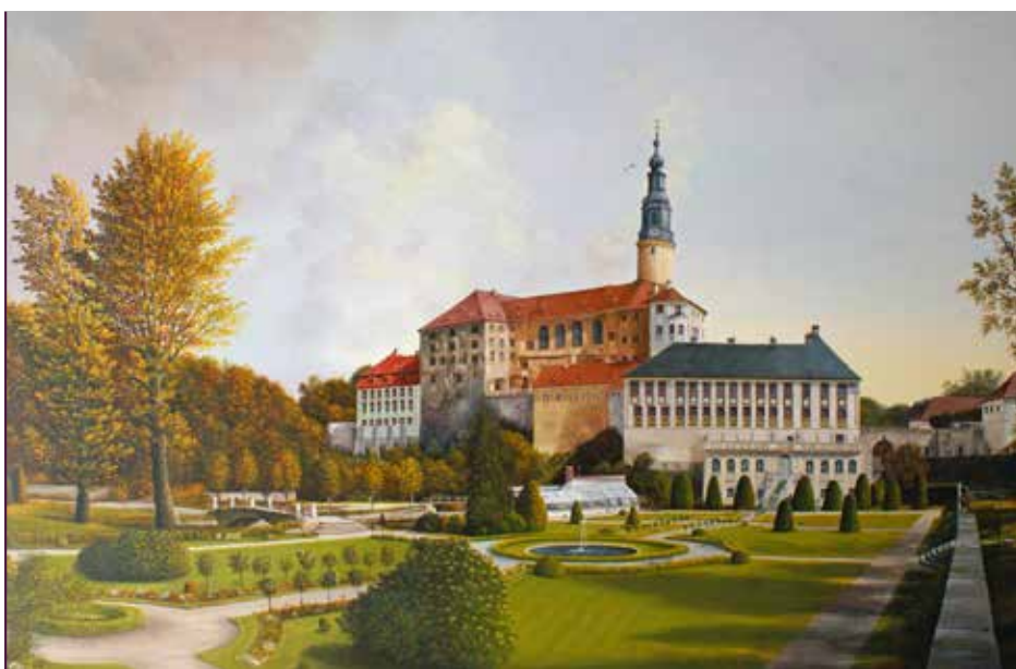
Mit Schloss Weesenstein fing es an. Seitdem sind 17 verschiedene Gemälde entstanden – meist Kopien nach alten Ansichten.