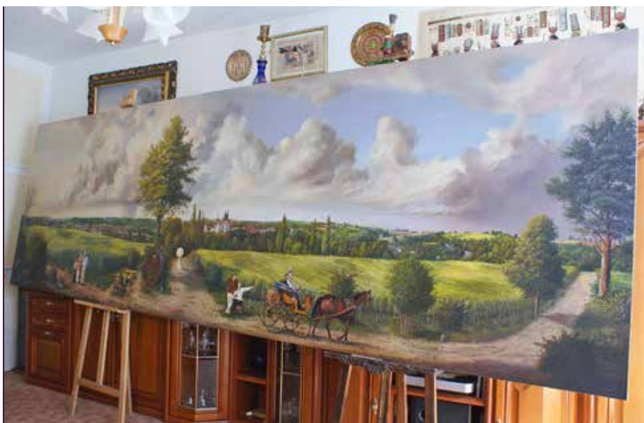
Das größte Gemälde, das Roland Schwenke malte, passte geradeso in sein damaliges Wohnzimmer. Heute hängt es in Schloss Proschwitz.

Auch für Schloss Proschwitz und Prinz zur Lippe hat Schwenke zahlreiche Porträts und Gemälde geschaffen. „Für ihn könnte ich malen, bis ich in die Kiste steige“,