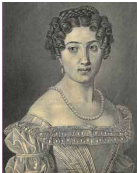
Prinzessin Amalie Auguste von Bayern, Lithografie, um 1830