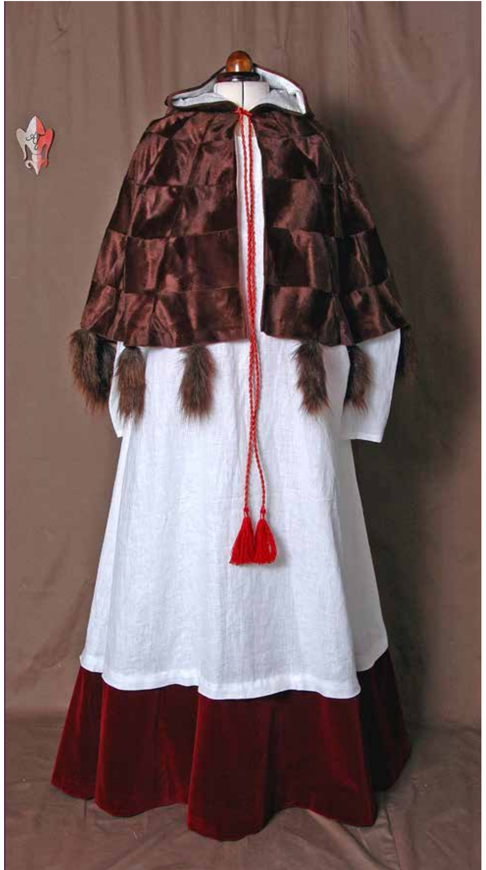
Nachgeschneiderte liturgische Kleidung eines Brandenburger Domherrn für das Dommuseum Brandenburg