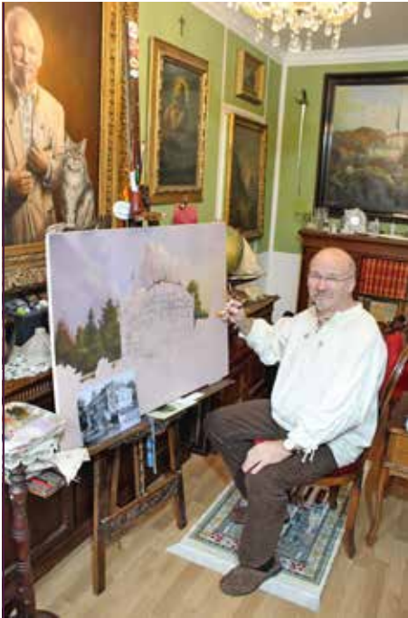
Ein neues Gemälde entsteht: eine Ansicht des Schlosses Seifersdorf, Dezember 2020