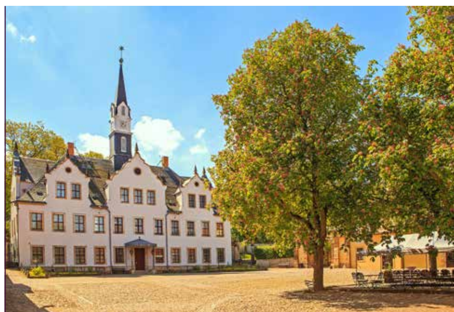
Schloss Burgk in Freital