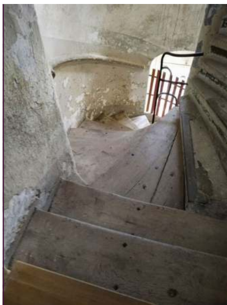
Mit Eichenholzbohlen belegte Sandsteinstufen

Der Freundeskreis Schlösserland Sachsen wirbt nun um Paten für die einzelnen Wendelstufen. Wir vergeben 30 Patenschaften à 300,00 Euro. Jeder Spender erhält „seine“ Treppenstufe. Wir vergeben die Stufen nach Spendeneingang, wobei wir dem Verlauf der Treppenspindel von oben nach unten folgen. Nach der Sanierung soll eine Kennzeichnung der Stufen mit Namen der Paten erfolgen – idealerweise durch kleine Schildchen. Wenn das aus technischen oder denkmalpflegerischen Gründen nicht geht, wird es eine Spendertafel im Treppenturm geben, die alle Namen mit Zuweisung der Stufen nennt. Wie bei unserem Projekt „Vögel für