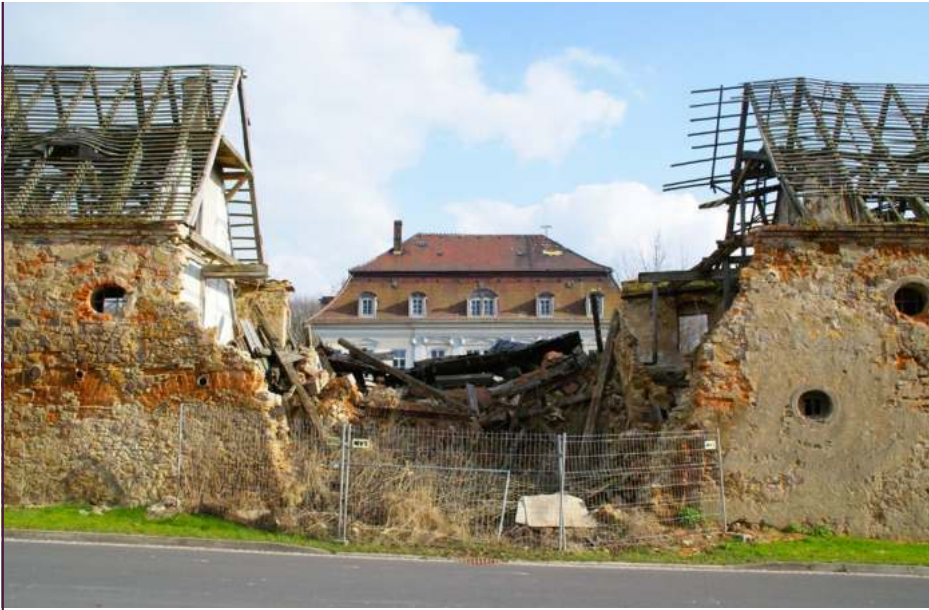
Steinbach bei Grimma, eingestürzter Turm

auf den ersten Blick ansieht. Ihre Fassaden wirken oft unansehnlich, viele dieser Bauten stehen schon seit 20 oder 30 Jahren leer. Dass sich keine Liebhaber finden, liegt manchmal gar nicht an den Gebäuden, sondern den Umständen vor Ort: So gehört zum Herrenhaus Hagenwerder (bis 1936 Nikrisch), einem bedeutenden Fachwerkbau des 18. Jahrhunderts nahe der Neiße, nur ein kleiner Grundstückstreifen. Der gesamte Rittergutshof ist in Grundstücke zer-