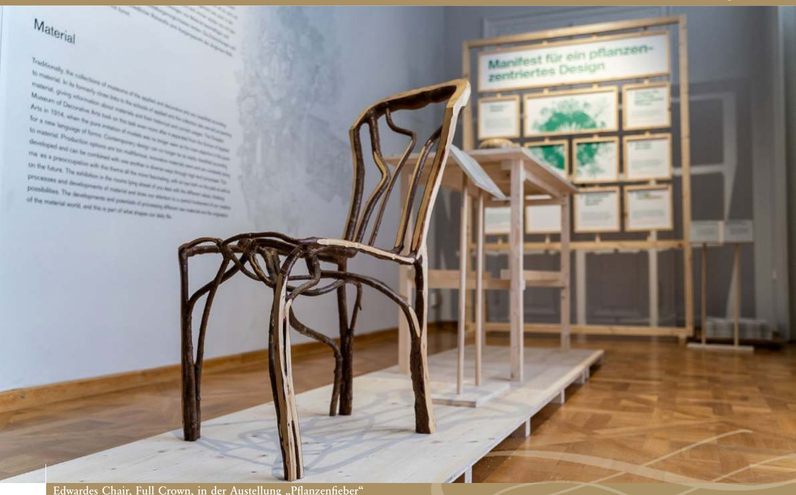
Edwardes Chair, Full Crown, in der Ausstellung „Pflanzenfieber“