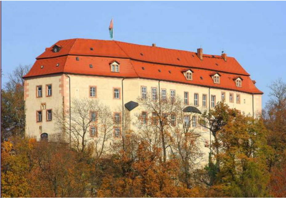
Schloss Wolkenburg: von der Stadt Limbach-Oberfrohna vorbildlich saniert

abgelehnt. Besonders bizarr ist die Situation in Meißen. Dort gelangte ein Teil des Burgbergensembles, das Kornhaus, aufgrund von Fehlentscheidungen vor 15 Jahren an einen privaten Eigentümer. Vertreter aller politischen Parteien, die für einen Erwerb durch den Freistaat Sachsen warben, blitzten im Finanzministerium ab. Dabei war das Kornhaus als Teil der Albrechtsburg und der Porzellanmanufaktur, bis 1918 als Absteige für königliche Besuche, immer ein Staatsgebäude gewesen.