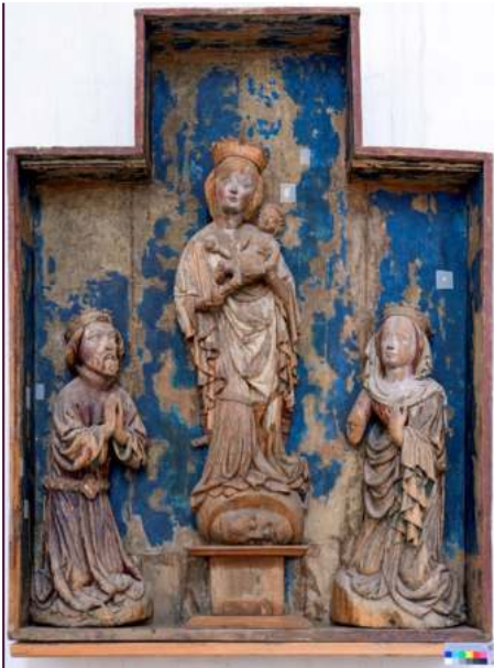
Altarretabel aus der Kirche in Chemnitz Ebersdorf mit Darstellung Friedrichs des Streitbaren und seiner Ehefrau als Stifter, um 1420

ten sahen ihre Chance. Zum Schluss war es der Meißner Markgraf, der zum Zuge kam. Friedrich konnte König Sigismund unter anderem mit seinen Truppen überzeugen. Dieser brauchte die Unterstützung des Meißners im Kampf gegen die aufständischen böhmischen Hussiten. Am 6. Januar 1423 unterschrieb er die Ernennungsurkunde, die offizielle Belehnungszeremonie erfolgte dann am 1. August 1425 in Ofen (Budapest).