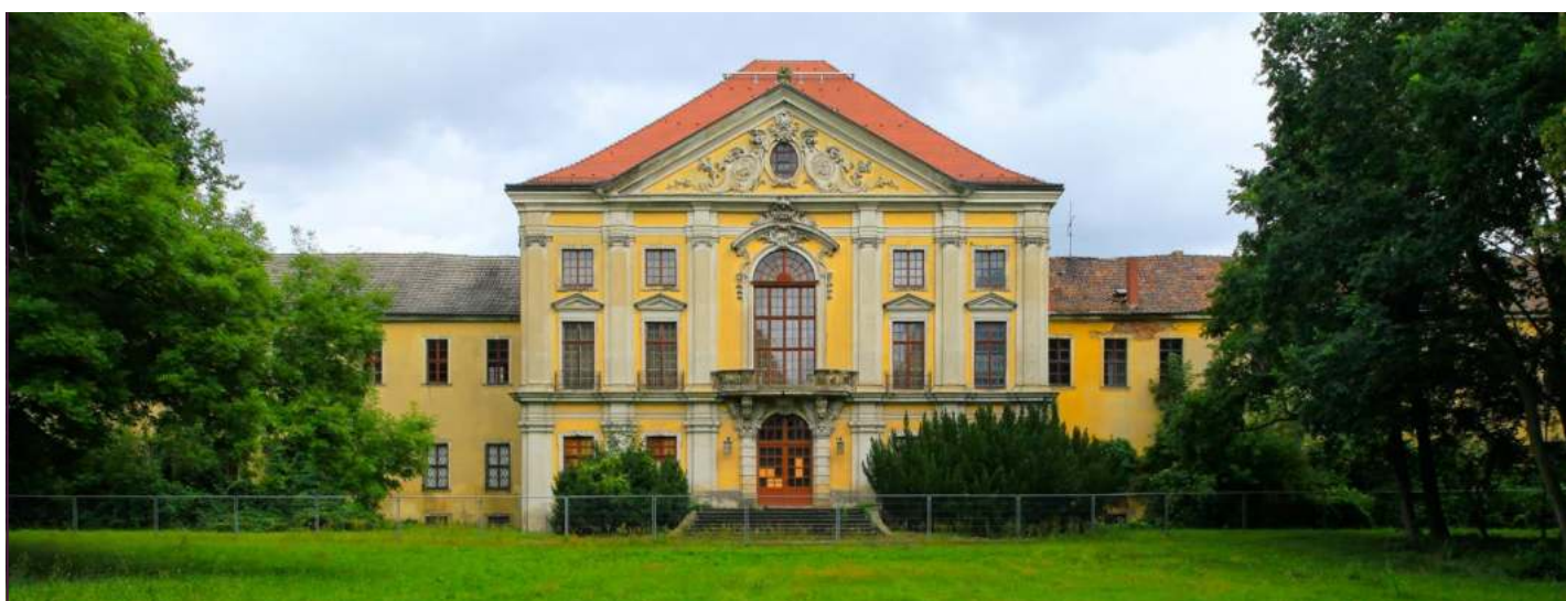
Schloss Schönwölkau: Noch immer ohne Nutzung

Eine zweite Gruppe bilden die kleineren Herrenhäuser, denen man ihren Wert nicht