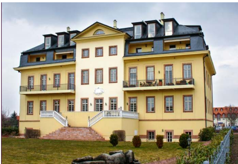
Schloss Zöbiger in Markkleeberg: heute Standort von Eigentumswohnungen nahe dem Cospudener See

Welche Sorgenkinder sind geblieben? Da ha-