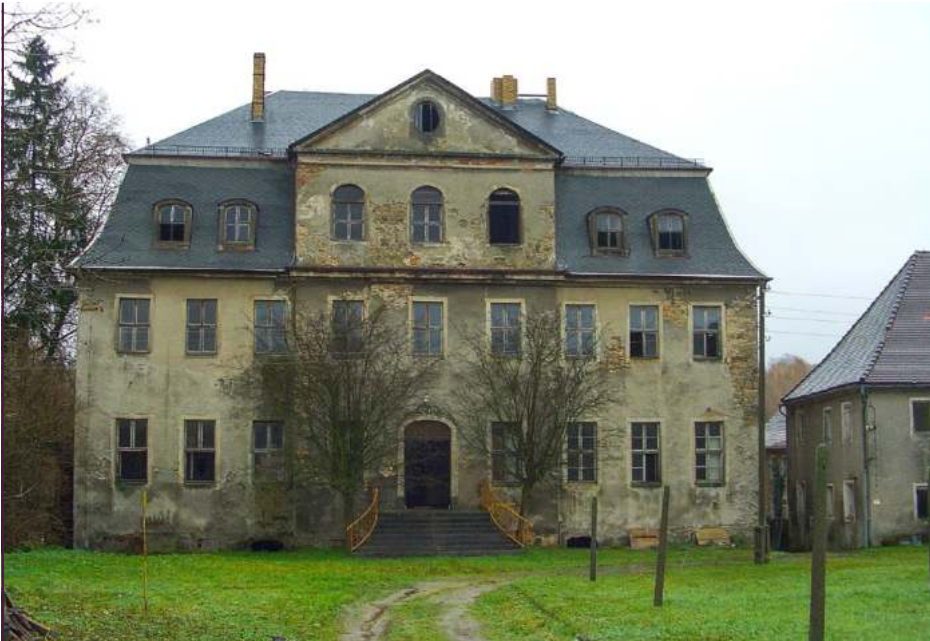
Schloss Schmölln im Jahr 2008 – noch vor dem Einsturz mehrerer Dachgauben