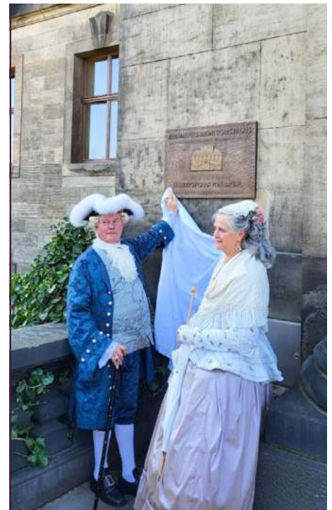
Enthüllung der Gedenktafel

ses engagierte. Nur so konnte ein Netz an Spuren und neuen Erkenntnissen entwickelt werden, das weit über die Brühlsche Terrasse hinaus reicht und den kulturellen Reichtum dieses Landes sichtbar macht. Ich freue mich außerordentlich – und ich denke, das kann ich nicht nur für meine Familie, sondern vor allem für viele Menschen in Dresden und Sachsen bekennen, – ich freue mich, dass es zu diesem Perspektivwechsel gekommen ist. Angesichts unseres neuen Kenntnisstandes sollten wir uns vielleicht heute nicht mehr die einseitige, ja, sachsen-unfreundliche Frage stellen: „Brühl, hamwa noch Geld?“, sondern stolz und dankbar auf die kulturelle Vielfalt in diesem Land schauen und all jenen Menschen danken, die sich selbstlos und unentgeltlich für Kulturentwicklung und -erhalt in Sachsen und weit darüber hinaus einsetzen. Herzlichen Dank!