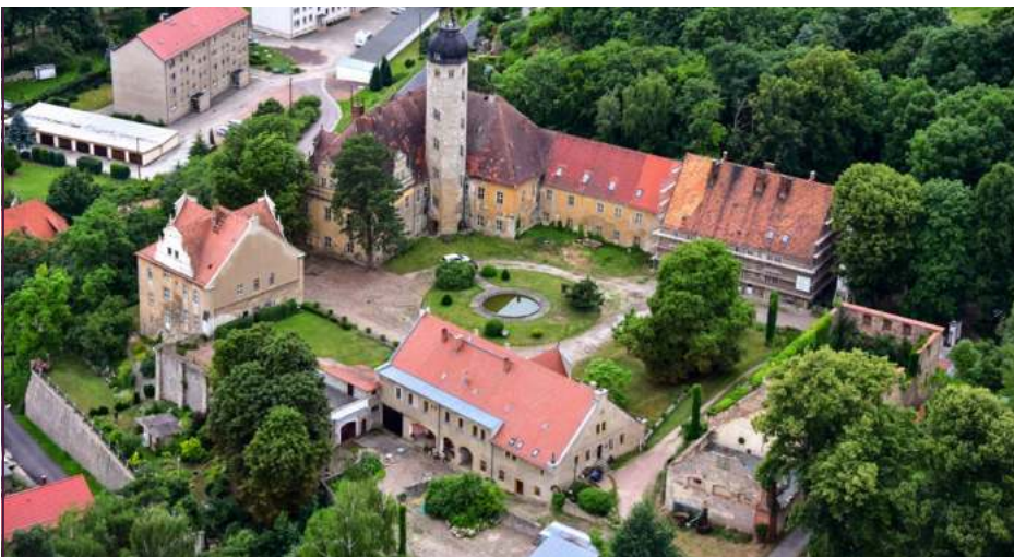
Schloss Schieritz bei Meißen, ehemals Wohnheim der LPG-Hochschule Meißen, wurde vom Freistaat Sachsen an Investoren verkauft, die das Ensemble verfallen lassen. Die Turmhaube musste abgenommen werden.