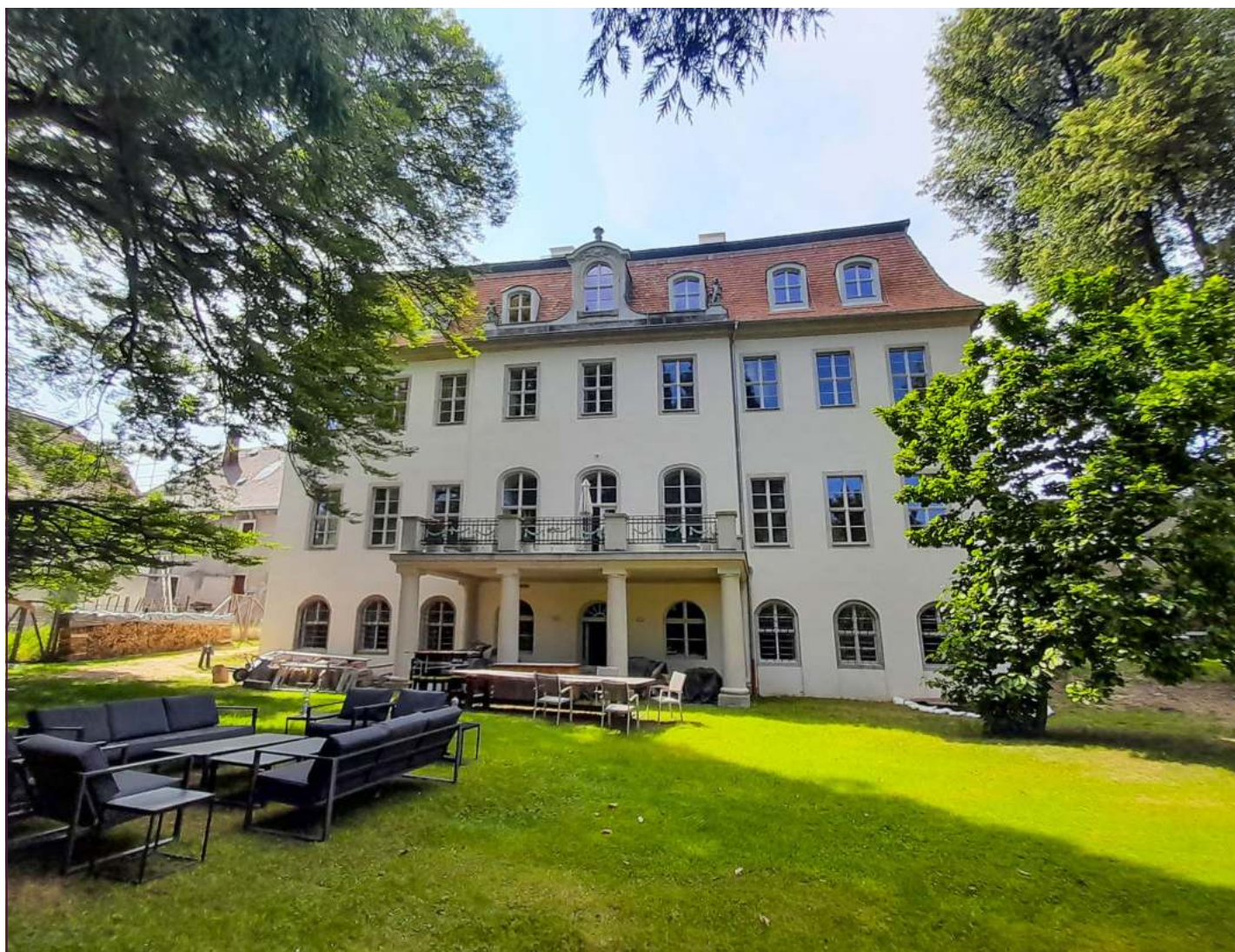
Gartenseite nach Abschluss der Dach- und Fassadenarbeiten

Während Dach und Fassade schon fertig sind, läuft derzeit der Innenausbau. Der ist nicht einfach, weil Heizungs- und Elektroleitungen im Boden verborgen werden müssen. Die Türen und sonstigen Einbauten fehlen noch. Wenn man das Nebengebäude sieht, das sich schon in Nutzung befindet, ahnt man, mit wie viel Geschmack die Einrichtung erfolgen wird. Während sich der Garten als sommerliches Refugium präsentiert und eine riesige gefiederte Buche Schatten spendet, sind die anderen Nebengebäude und der Hof noch eine Baustelle. Ursula Hoff hat aber klare Vorstellungen, wie es einmal aussehen wird: „In die alte Scheune, die kein Dach mehr hat, kommt unsere Holzpellettheizung samt dem Pel-