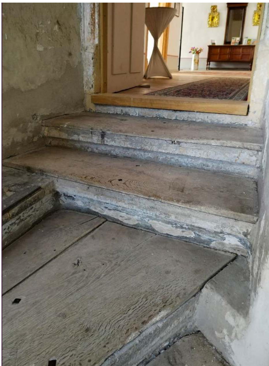
Die Stufen sind sanierungsbedürftig, wie hier beim Austritt in die Veranstaltungsetage

Schloss Rammenau“ bleibt die Patenschaft dauerhaft bestehen – sie ist nicht zeitlich begrenzt.