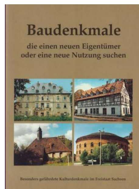
Immobilienkatalog des Freistaats Sachsen zur Privatisierung von Baudenkmalen, Ausgabe 1999

An der Haltung des Finanzministeriums, den Freistaat Sachsen nicht mit Schlössern zu belasten, hat sich bis heute nichts geändert: Alle Vorschläge, Objekte von landesweiter Bedeutung in die Reihe der staatlichen Schlösser aufzunehmen, wurden