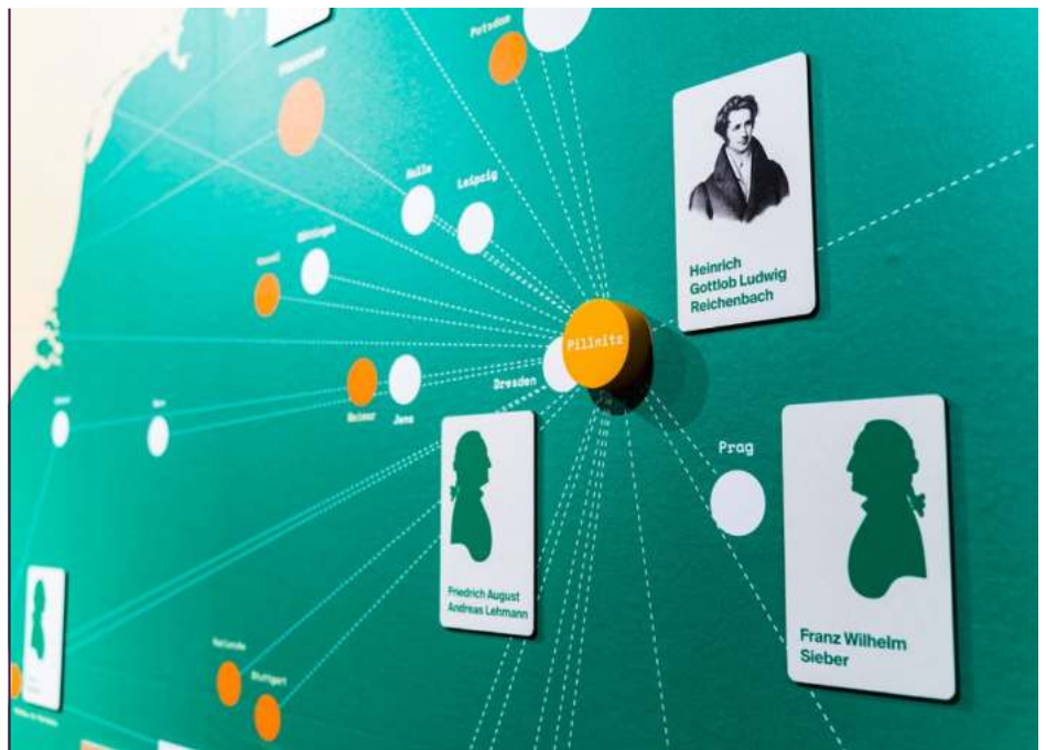
Netzwerkkarte der Pflanzenforschung in Europa

anderes, als in Form gebrachte Natur. Und wenn wir heute davon inspiriert im Baumarkt stehen, um Pflanzen zur Gestaltung unseres Vorgartens zu erwählen, würden wir schier verzweifeln, wenn nicht alles haarklein beschrieben und angeleitet wäre, um den Pflanzen die geeigneten Bedingungen zu geben: Lichtverhältnisse, Bodenbeschaffenheit und Pflege. Und damit nicht nur die Existenzbedingungen „gesichert“ sind, erfahren wir auch wann, wie und in welcher Weise die Pflanze wächst und blüht, damit wir sie je nach Geschmack im Garten arrangieren können. All dieses uns heute zugängliche Wissen um die Kulturansprüche der Pflanzen musste aber generiert werden – und dies passierte auch in Pillnitz! Von 1780 bis 1865 war Pillnitz Teil einer wissenschaftlichen Gemeinschaft, eines Netzwerkes an Forschern, die Ordnung und System in die unbekannte Pflanzenwelt brachte und uns heute befähigt, Samentütchen informativ zu beschriften. Die Protagonisten in Pillnitz waren keine geringeren als die Könige Friedrich August I. (1750–1827) und sein Neffe Friedrich August II. (1797–1854), von deren Wirken und Forschungen wichtige Impulse für Forstwirtschaft, Gartengestaltung und -technik ausgegangen sind. Aber auch schon Friedrich August I. (1670–1733), besser bekannt als August der Starke, war bereits im Pflanzenfieber; auf