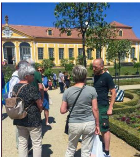
Der Orangeur erklärt jeden einzelnen Baum und welche Pflegearbeiten er erfordert

Wie angekündigt, blieben die Orangebäume im vergangenen und auch in diesem Sommer im Barockgarten Großsedlitz. Die Orangebaumpaten konnten sich von deren gutem Zustand in beiden Jahren zu den Zitrustagen jeweils Ende Mai überzeugen. Die Patentreffen in Großsedlitz dienten dazu, den Paten ein Dankeschön zu sagen und über den aktuellen Stand zu informieren. Beide Patentreffen wurden gut angenommen, allerdings fehlen derzeit Paten für 10 Bäumchen. Wir werben wei-