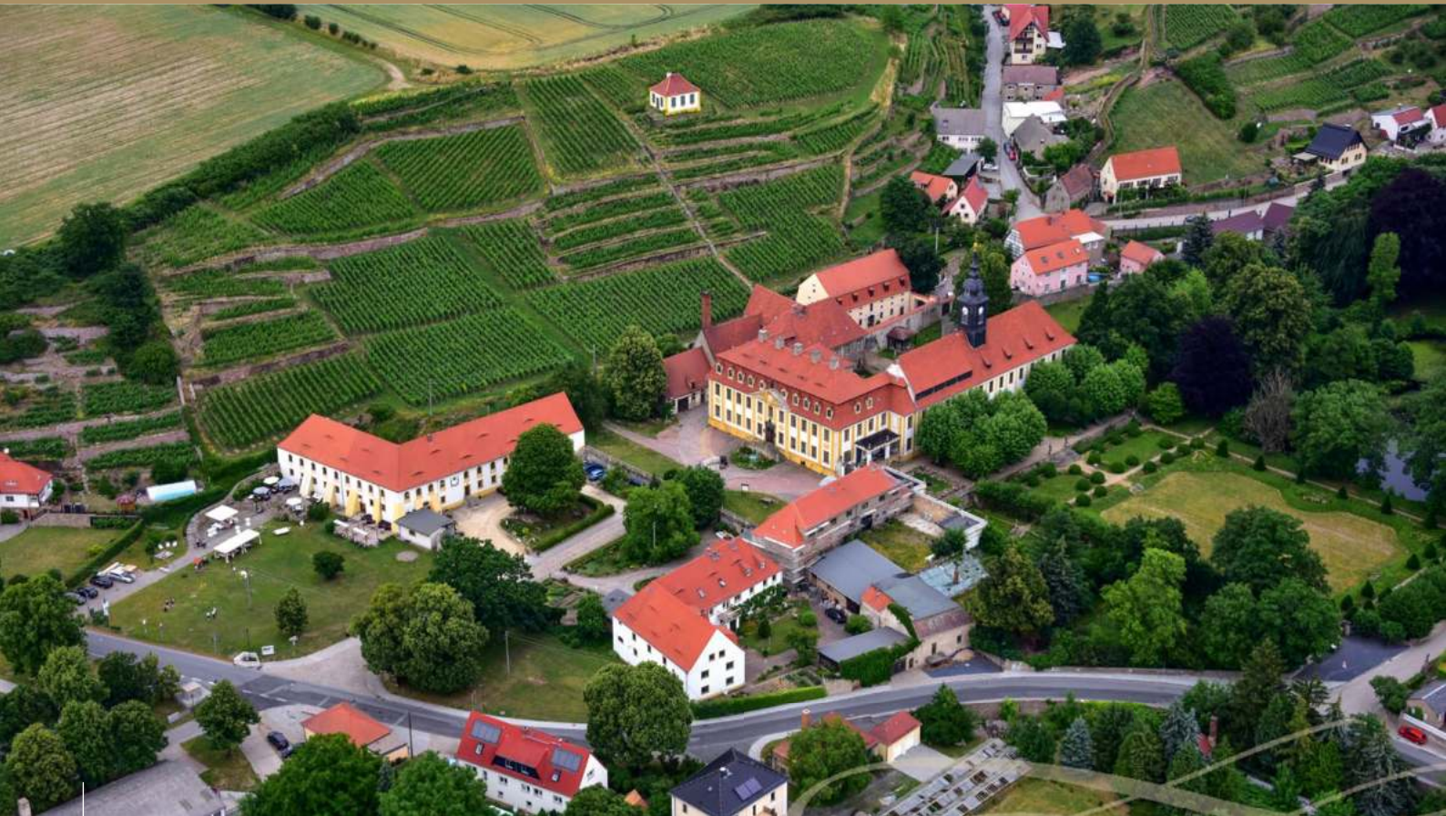
Noch immer ohne Nutzung: Schloss Seußlitz bei Meißen