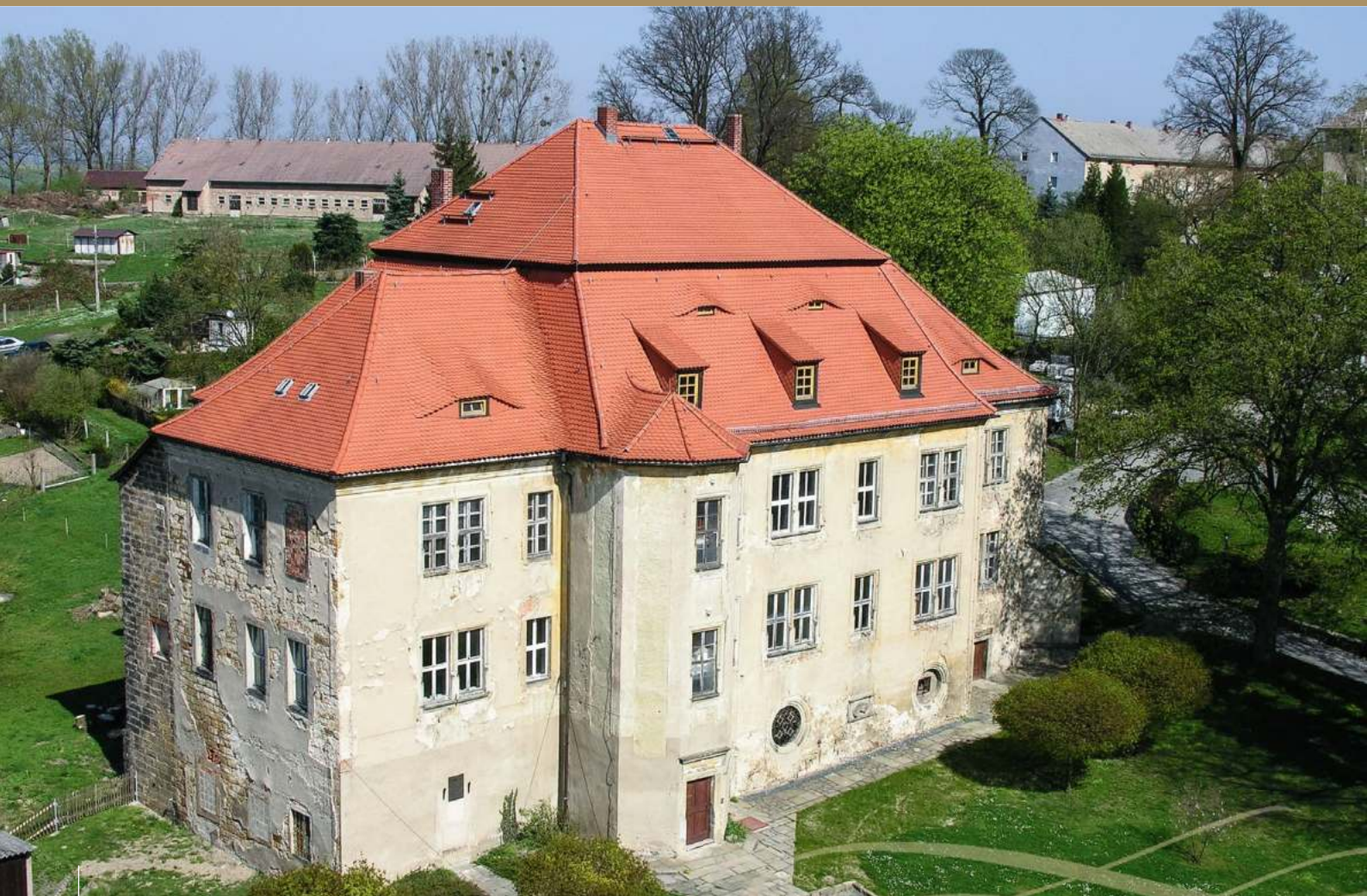
Schloss Struppen mit dem Wendelstein an der Ostfassade, Zustand vor der aktuell laufenden Fassadensanierung