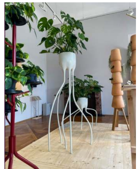
Pflanztöpfe „Monstera Fugiens“, Tim van de Weerd