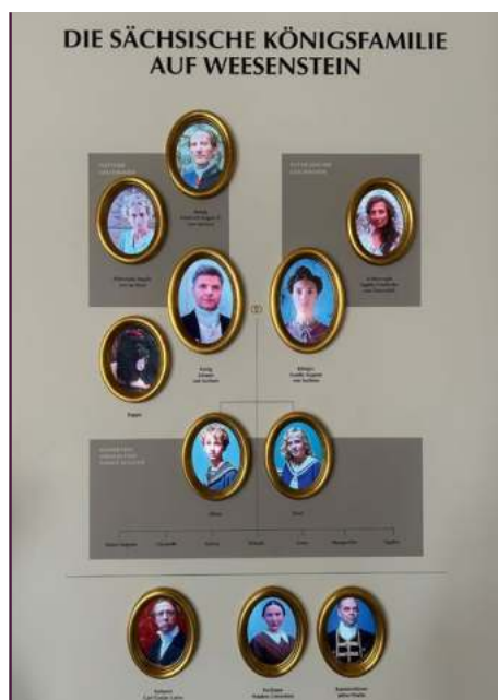
Begrüßungsbildschirm im Salettchen mit der Vorstellung aller Mitwirkenden

Als großes Vorbild diente die erfolgreiche englische Kultserie „Downton Abbey“, die Geschichte einer Adelsfamilie. Oben - in den schicken Palastgemächern und -sälen spielen sich die Geschichten der adligen Familienmitglieder ab und unten - im von der Diener-