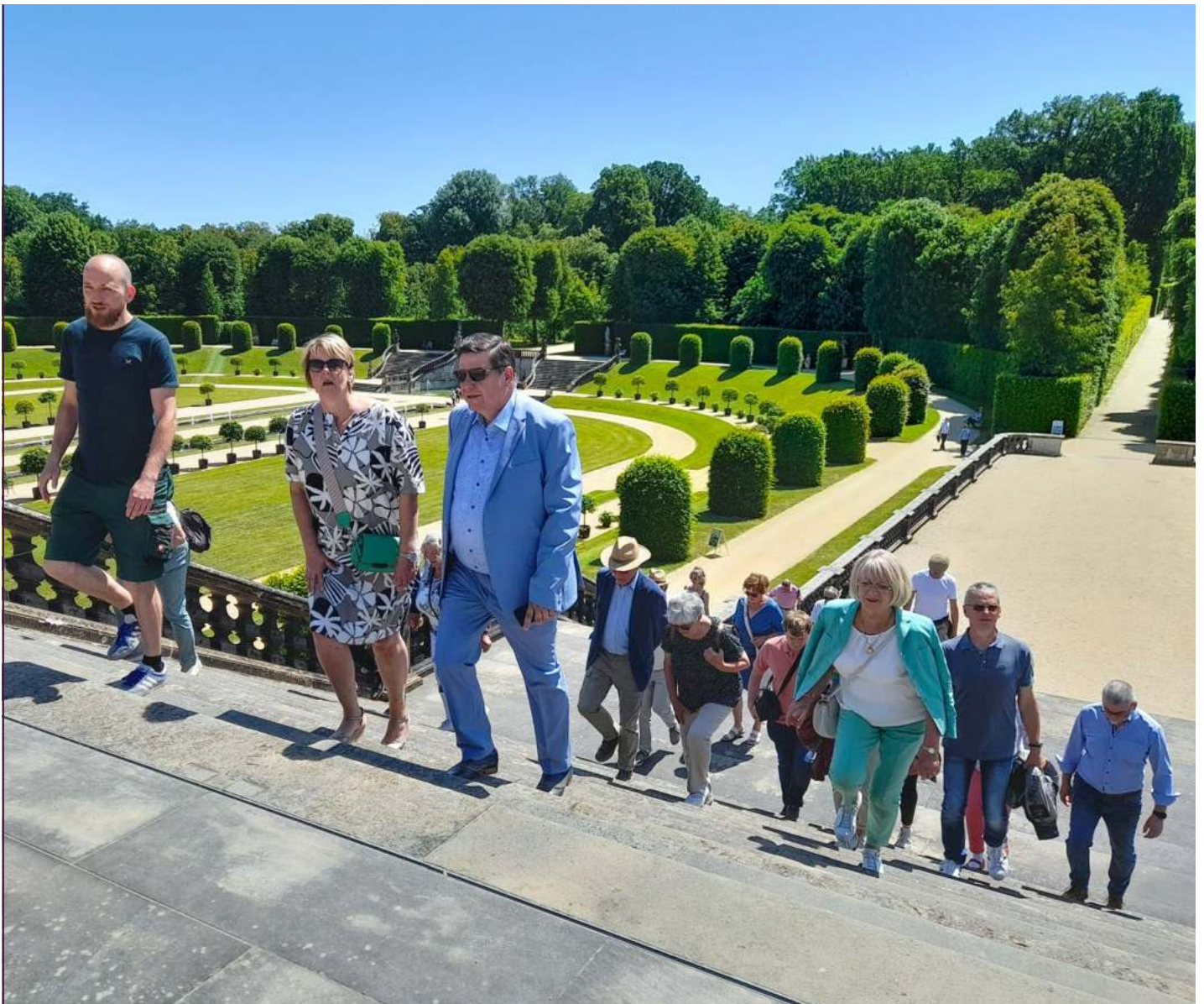
Der Orangeur und die Orangenbaumpaten zum Patentreffen am 4. Juni 2023 im Barockgarten Großsedlitz

Es folgte die Abstimmung über ein neues Spendenprojekt. Vorschläge konnten von Schlössern und Vereinen bis zum 31. März 2023 eingereicht werden. Es gab nur eine Bewerbung von Schloss Struppen für die denkmalgerechte Restaurierung der Stufen des historischen Wendelsteins. Mit 37 Ja-Stimmen wurde das Projekt einstimmig angenommen.