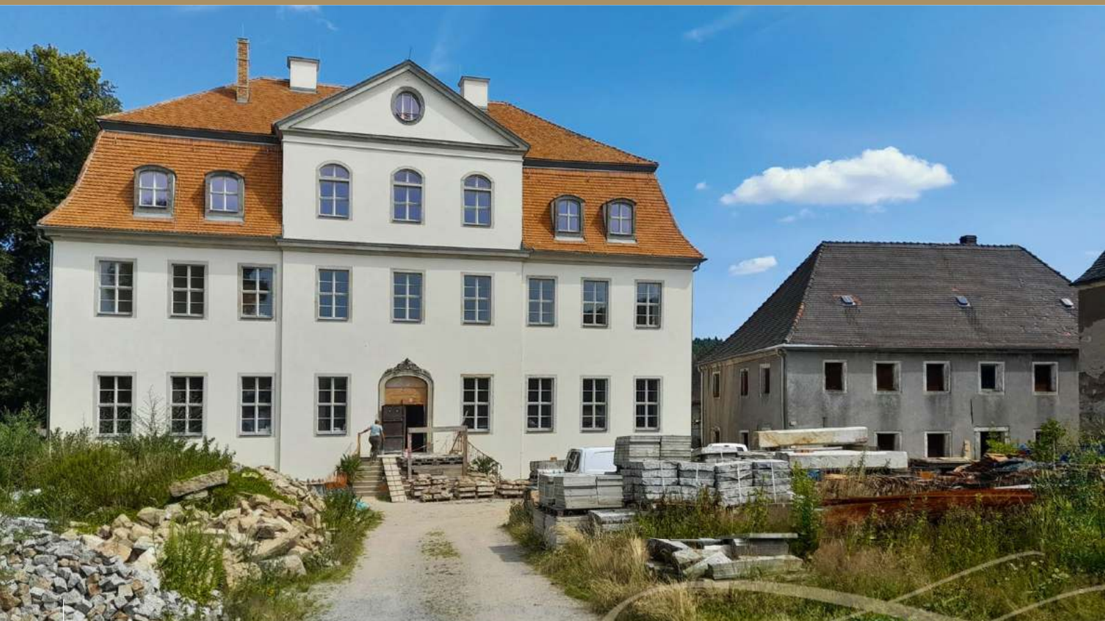
Schloss Schmölln im Bau, Juli 2023