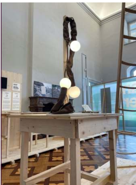
Leuchterserie „Senilla 11“, Highsociety Studio