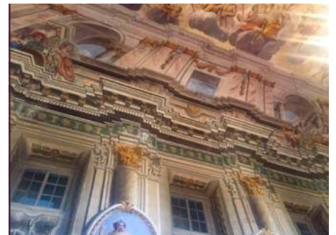
Beiratstreffen im Schloss Crossen

Der Beirat trifft sich mehrfach im Jahr und sammelt Ideen, die zur Mitgliedererwerbung und Gestaltung von Projekten beitragen. Jedes Beiratsmitglied kann auf Grund seiner persönlichen Netzwerke, Profession oder Interessen verschiedene Dinge einbringen. Unter anderem vertreten sind Gärtner, Lehrer, Ingenieure und Historiker. Manche erforschen im Archiv die sächsische Adelsgeschichte, andere bringen mit Kostümen und Tänzen der Bevölkerung die Geschichte nahe. Dieses Konzept entspringt der wissenschaftlich anerkannten Strömung der Living History. Mit unseren unterschiedlichen Ansätzen gelingt es uns, die Beiratssitzungen zu sehr fruchtbaren wie auch interessanten Treffen werden zu lassen.