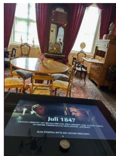
König Johann-Zimmer mit Bildschirm (Dante-Szene)

Schließlich musste der Film noch geschnitten und der Ton gemischt werden. Dann wurden noch die neuen Ausstellungsmöbel gebaut, um die Filme zu präsentieren. Seit dem 1. April 2023 heißt es im Schloss Weesenstein „Film ab!“.