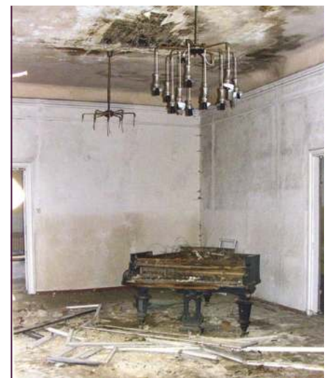
Verfallenes Inneres im Jahr 2008