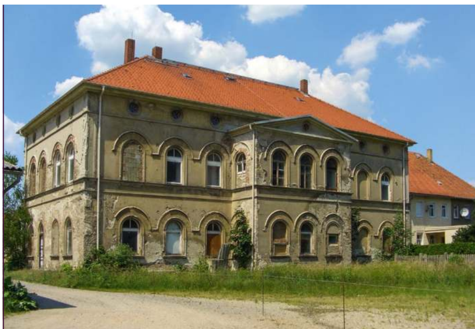
So wie hier in Saritsch sahen in den 1990er Jahren viele Herrenhäuser im ländlichen Raum aus

Richtungsentscheidungen getroffen hätte. Vielmehr haben die Schlösser überlebt, viele zumindest, obwohl die Bedingungen äußerst ungünstig für sie waren.