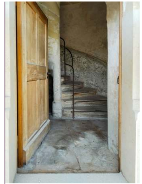
Blick in den Wendelstein

Die Sanierung der eichenholzbelegten Treppenstufen ist in Verbindung mit der Sanierung und Instandsetzung der Innenwände des Wendelsteines (Putzausbesserung und Malerarbeiten) geplant. Gegenstand des Spendenprojektes ist die Aufarbeitung der eigentlichen Stufen, bestehend aus den Eichenholz-Trittflächen und dem Sandstein-Unterbau. Insbesondere sind hierfür die Sandsteinstufen zu reparieren, teils mit Vierungen und Mörtelergänzungen zu vervollständigen und zu festigen. Die auf-