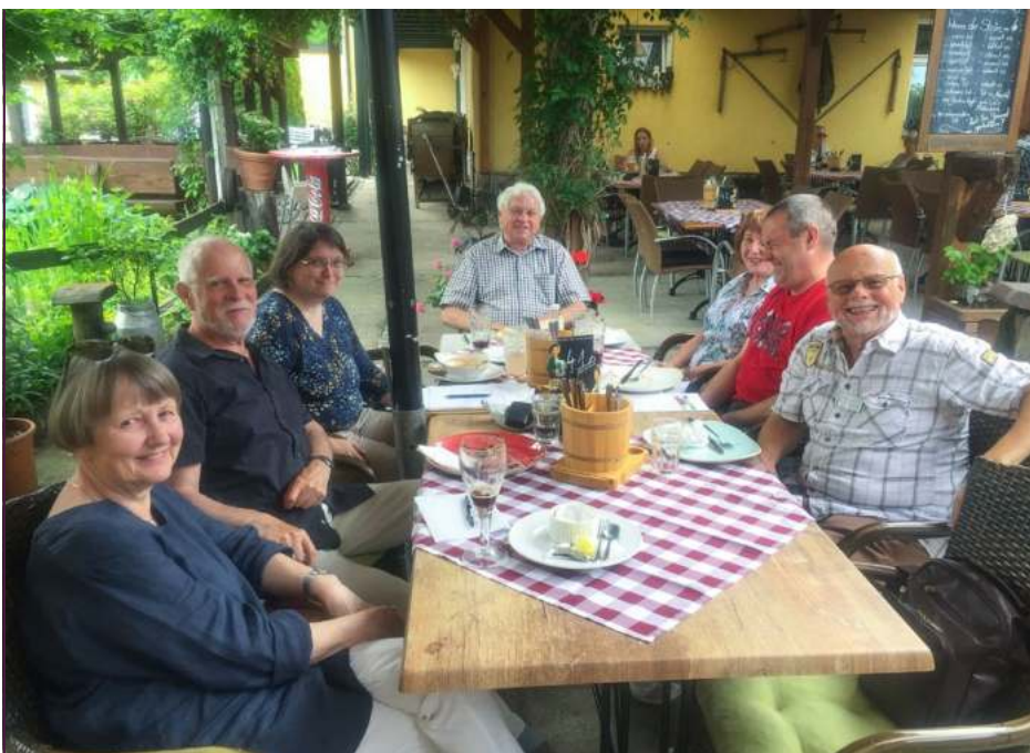
Beiratstreffen in Cotta

Der Beirat freut sich über jeden Interessenten, der vorbeischaun möchte. Es lohnt sich! Bitte um Anmeldung an asrous@gmail.com