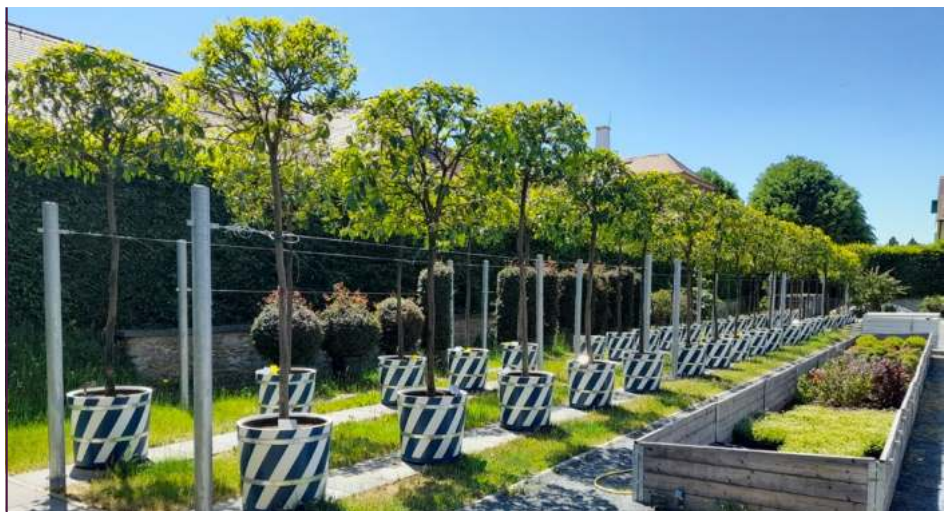
Die in größere Kübel „umgetopften“ Bäume warten im Gartenbereich des Barockgarten Großsedlitz darauf, dass sie im Freigelände aufgestellt werden können

ter für Paten, jedoch schätzt der Vorstand ein, dass dieses Spendenprojekt erst dann wieder Fahrt aufnehmen wird, wenn die Bäume nach Abschluss der Bauarbeiten wieder in den Zwinger umziehen können. Bis dahin werden die Patentreffen in der jetzigen Form fortgeführt.