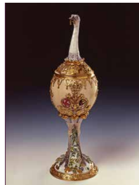
Straußeneipokal im Grünen Gewölbe in Dresden, gefertigt 1734 aus dem Ei eines Straußens, der bei der Afrikaexpedition erworben und nach Moritzburg gebracht worden war

August der Starke hatte eine besondere Affinität zu Afrika. Er schmückte sich mit Afrikanischem, um zu zeigen, dass sein Herrschaftsanspruch die ganze bekannte Welt umfasste. Verschiedenste Inszenierungen präsentierten die damals bekannten Kontinente Europa, Afrika, Asien und Amerika und zeigten damit, dass Augusts Selbstdarstellung keine Grenzen kannte. Wiederholt veranstaltete er Feste, bei denen er selbst oder Gäste als verkleidete Afrikaner auftraten. Dabei zeigte sich der Kurfürst und König selbst als „Mohrenkönig“ oder „Chef der Afrikaner“, etwa 1701 beim Ringrennen in Warschau oder 1709 anlässlich des Staatsbesuchs des dänischen Königs Friedrich IV. in Dresden. Das Afrikabild dieser Zeit hatte noch keinen wissenschaftlichen Hintergrund. Bei den Inszenierungen vermengte man fremdartig wirkende Attribute, die aus unterschiedlichen Kulturen, auch aus nichtafrikanischen, entlehnt waren. So