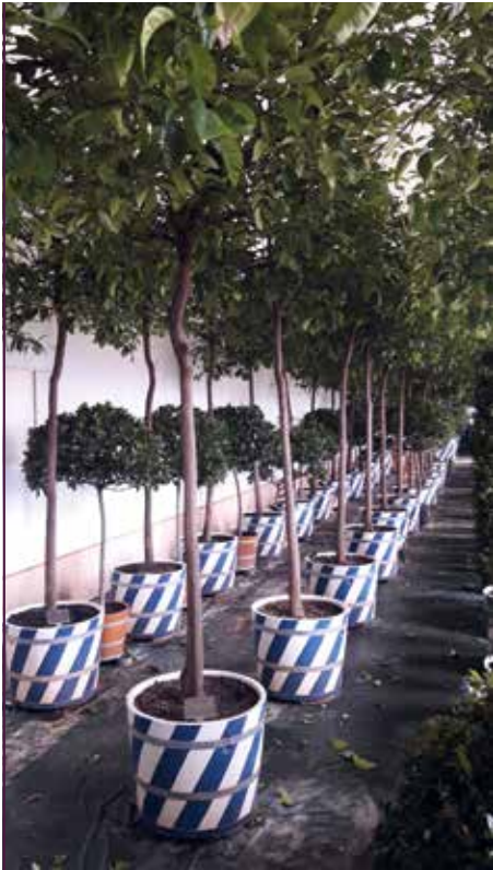
Die Bäume überwintern in der Oberen Orangerie im Barockgarten Großsedlitz.

bevolle Hand für den Formschnitt der Krone. Schädlinge sind zu bekämpfen und leider auch mutwillige Beschädigungen an Kübeln und Stämmen zu heilen. Bei rund 80 Bäumen ist das ein erheblicher Arbeitsaufwand. Man staunt über die Menge, wenn die Bäume dicht an dicht in der Orangerie stehen und das Gebäude, obwohl es doch ziemlich groß ist, ganz ausfüllen.