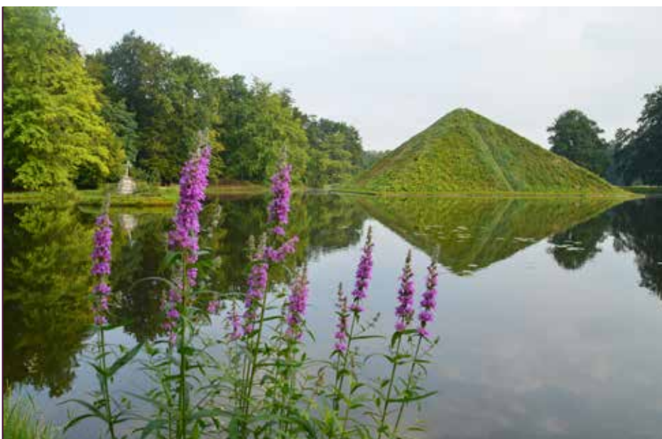
Blick zur restaurierten Seepyramide im Branitzer Park, Begräbnisstätte der Fürstin und des Fürsten Pückler