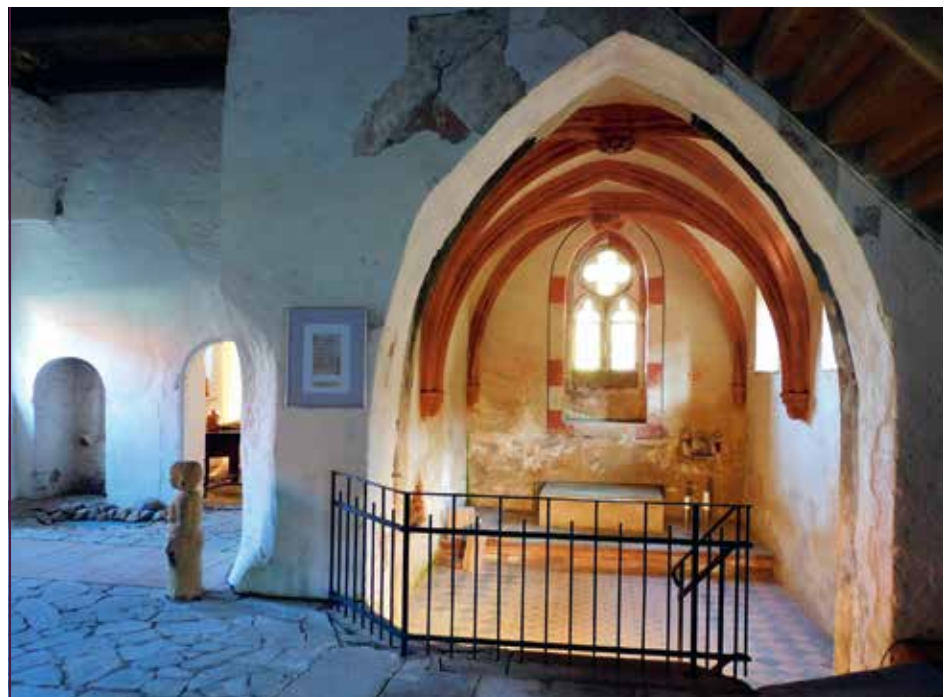
Teile des mittelalterlichen Klosters Buch sind trotz Reformation und Umwandlung in ein landwirtschaftliches Gut erhalten geblieben.