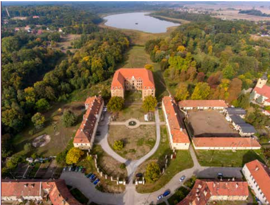
Schloss und Schlosspark in Pförtner

Erdarchitekturen Seepyramide, Landpyramide und Hermannsberg, die Wiedereinrichtung der „Baumuniversität“ als parkeigener Spezialbaumschule und meine Dissertation, in der ich mich dem Thema „Park und Schloss Branitz nach Fürst Pückler“ widmen konnte. Alles immer mit Blick auf den Dreiklang, der mein und unser gartendenkmalpflegerisches