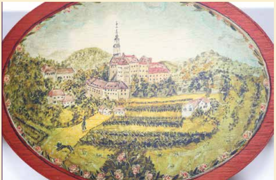
Spanschachtel mit Ansicht von Schloss Weesenstein

Die Tradition der bemalten Spanschachtel ist lang. Handwerker besserten mit der Herstellung im Winter ihren Ver-