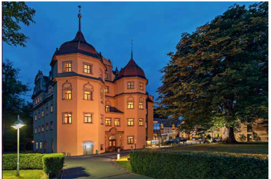
In Schloss Althörnitz bei Zittau ist Oberlausitzer Geschichte lebendig.

Anmutig eingebettet in eine weitläufige Parklandschaft, befindet sich am östlichsten Punkt Sachsens im Dreiländereck das Schlosshotel Althörnitz. Zwei stolz in den Himmel ragende Renaissancetürme begrüßen die Gäste am Schlosseingang. Hinter den historischen Mauern laden 75 verwinkelte Zimmer zum Verweilen ein. Ein Hauch Schlossgeschichte und frisch zubereitete Spezialitäten aus der Region hält das Restaurant »Hörnitzer Schlosstube« bereit.