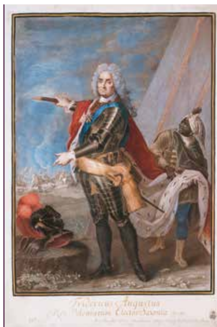
August der Starke mit einem „Kammernohren“, Stich nach einem Gemälde von Antoine Pesne, um 1720

Afrika faszinierte die Menschen in Europa. Vor allem die Herrscherhäuser wollten sich mit dem Reiz des fremden Kontinents schmücken, der als „exotisch“ und „geheimnisvoll“ galt. Kontakte nach Afrika gab es nur sehr wenige, vor allem vermittelt durch die europäischen Handelsgesellschaften, die Forts an den Küsten West- und Südafrikas gegründet und einen transatlantischen Sklavenhandel etabliert hatten. Ein Umschlagplatz für die Güter dieser Handelskompanien waren die Leipziger Messen. Nachdem August der Starke (1670–1733) zum König von Polen gekrönt worden war, zeigte er sich der Idee aufgeschlossen, eine königlich polnische Handelskompanie zu gründen. Dieses Vorhaben scheiterte am Ausbruch des Nordischen Krieges. Der kühne Gedanke, ähnliche wie Dänemark, Schweden und Brandenburg „Eyländer“