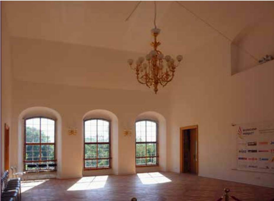
Schloss Dahlen, der wieder nutzbare Kaisersaal