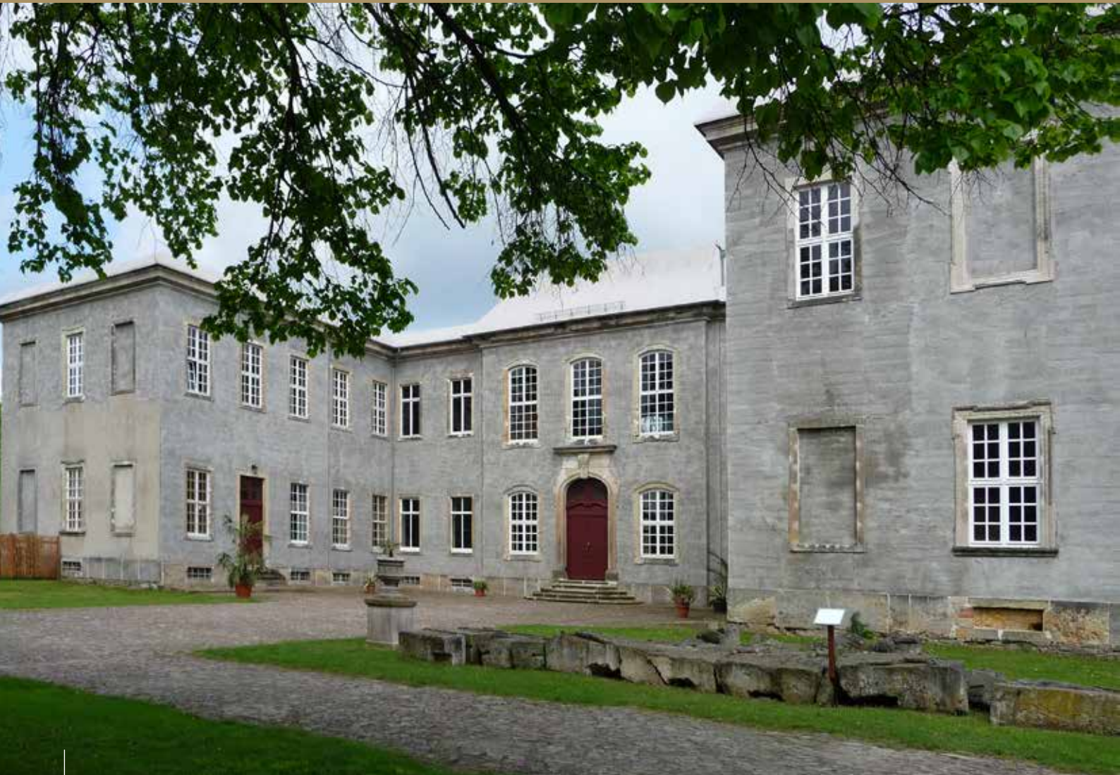
Schloss Dahlen, Zustand nach der Notsicherung