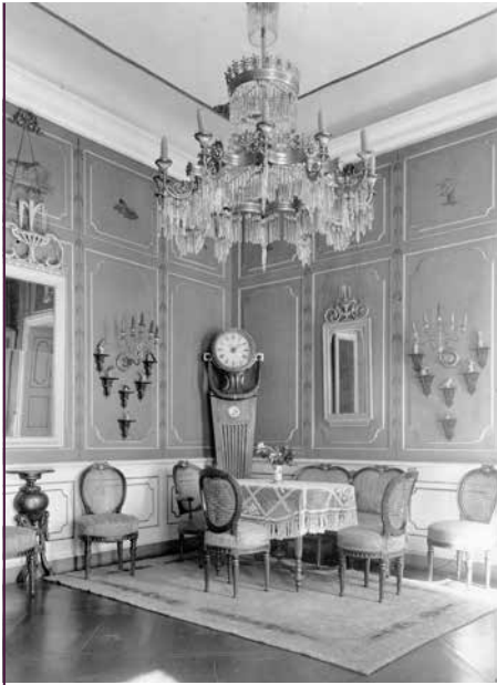
Vogelzimmer im Schloss Rammenau, Zustand 1937

eine Restaurierung des Bestandes, bei der die klassizistischen Holzvertäfelungen wiederhergestellt und die Vogelbilder freigelegt wurden. Schon im Frühjahr 2017 trat die Schlossleiterin Ines Eschler an den Freundeskreis heran und schlug ein Spendenprojekt vor, welches auf der Mitgliederversammlung am 10. Juni 2017 einstimmig beschlossen wurde.