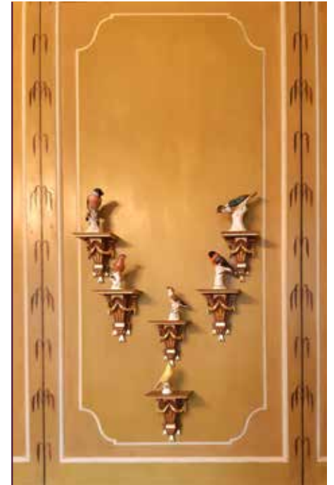
Ein fertiges Wandfeld, bestückt mit einheimischen Vögeln aus Meißner Porzellan