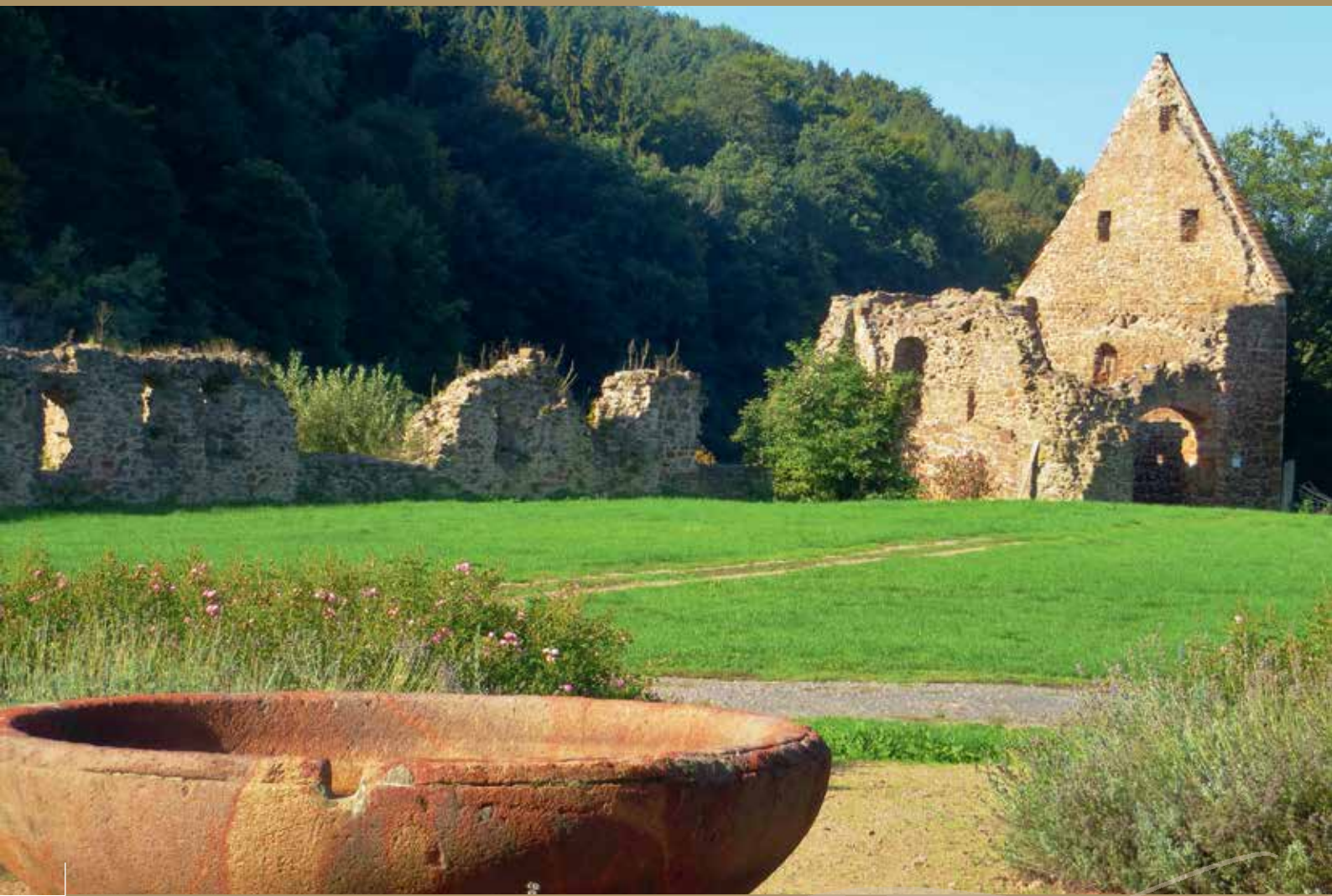
Ruinen des Zisterzienserklosters Buchs in Klosterbuch bei Leisnig