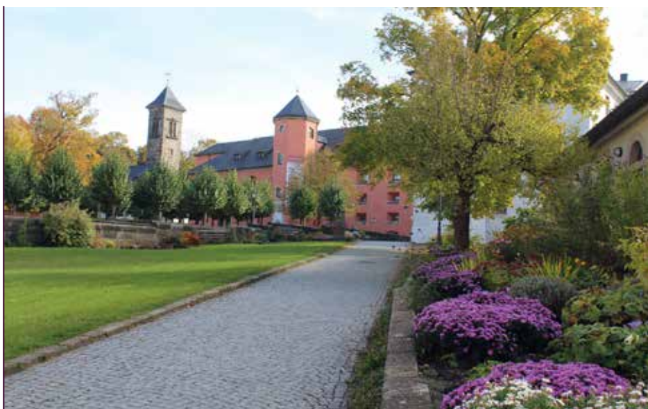
Auf dem Weg zur frisch sanierten Magdalenenburg