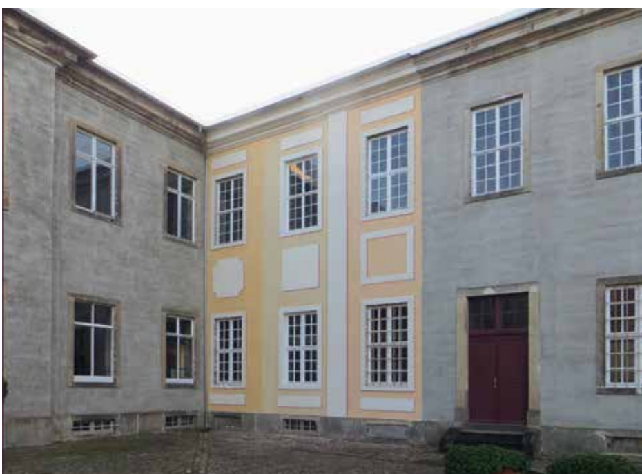
Schloss Dahlen, Musterachse für die Farbgestaltung

es allerdings in diesem Jahr nicht weiter, denn der Verein muss zunächst wieder Eigenmittel beschaffen. Die Stadt Dahlen ist zwar Eigentümerin, das Geld aber kommt ausschließlich vom Schlossverein.