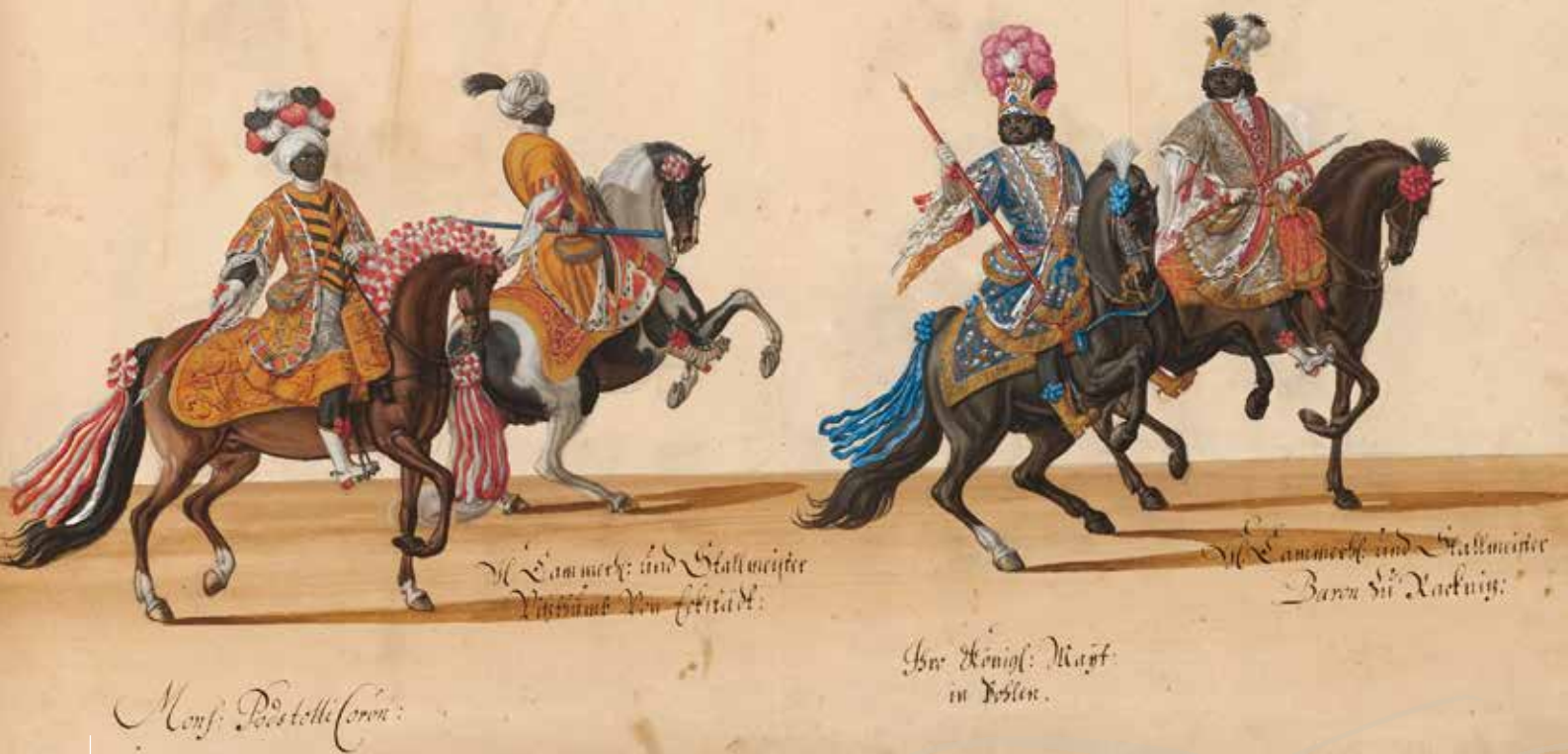
August der Starke und Gefolge verkleidet als Afrikaner. Darstellung der sogenannten „Mohrenquadrille“ beim Kopffrennen am 5. Februar 1701 in Warschau