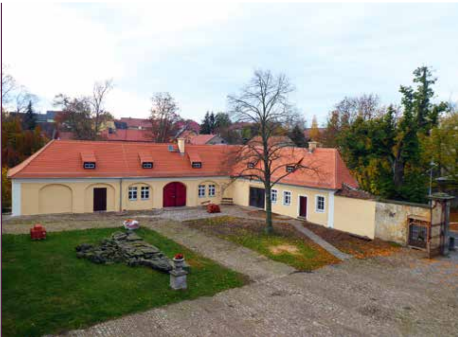
Nebengebäude des Schlosses, das vollständig restauriert wurde