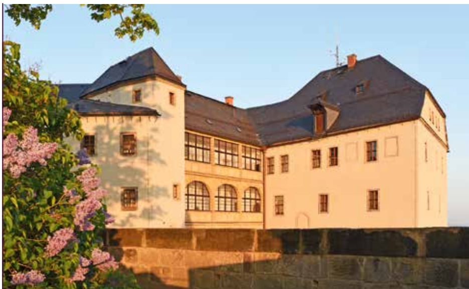
Die Georgenburg in der Morgensonne