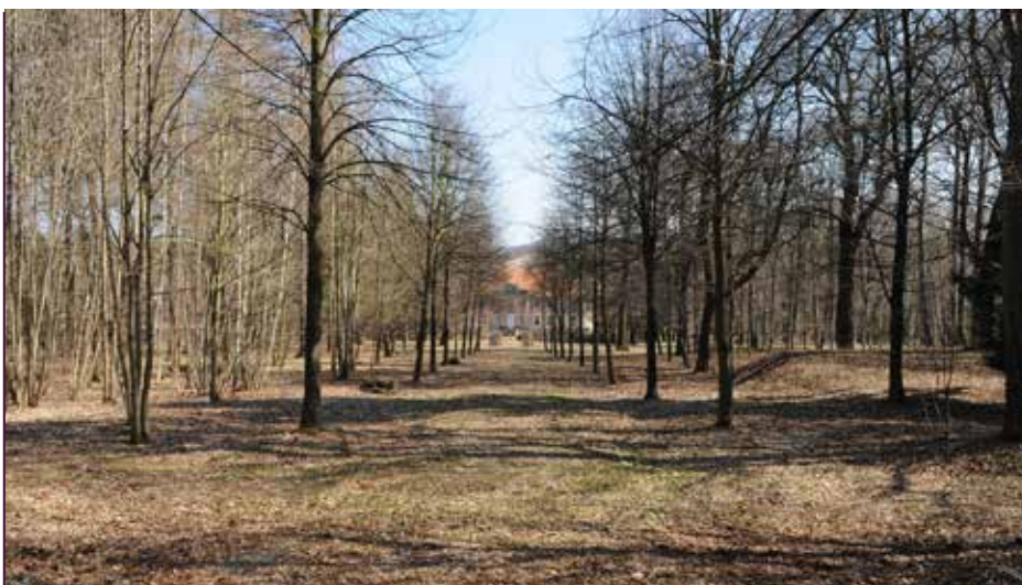
Ein Schlosspark in Privatbesitz bringt viele Benachteiligungen, z. B. bei der Berechnung der Grundsteuer.

Um zum Schloss Uhyst zurückzukommen: In Vorbereitung ist eine Stellungnahme zur Nutzung leerstehender Schlösser bei der Ansiedlung von Landes- und Bundeseinrichtungen in strukturschwachen Regionen wie auch beim Strukturwandel in den Braunkohleabbaugebieten. Uhyst/Spree ist ein solcher Ort des Strukturwandels. Warum soll es nicht möglich sein, die vorhandene Bausubstanz für Neuansiedlungen zu nutzen? Das schont vorhandene Ressourcen und gibt den Kulturdenkmälern in den strukturschwachen ländlichen Regionen eine Chance. Und auch das Thema der Grundsteuer wird uns beschäftigen. 2025 erfolgt eine umfassende Neuregelung, bei der jedes Bundesland einen eigenen Gestaltungsspielraum hat. Wir hoffen, dass wir Interessen privater Schloss- und Parkeigentümer bei der Neuberechnung der Grundsteuer einbringen können.