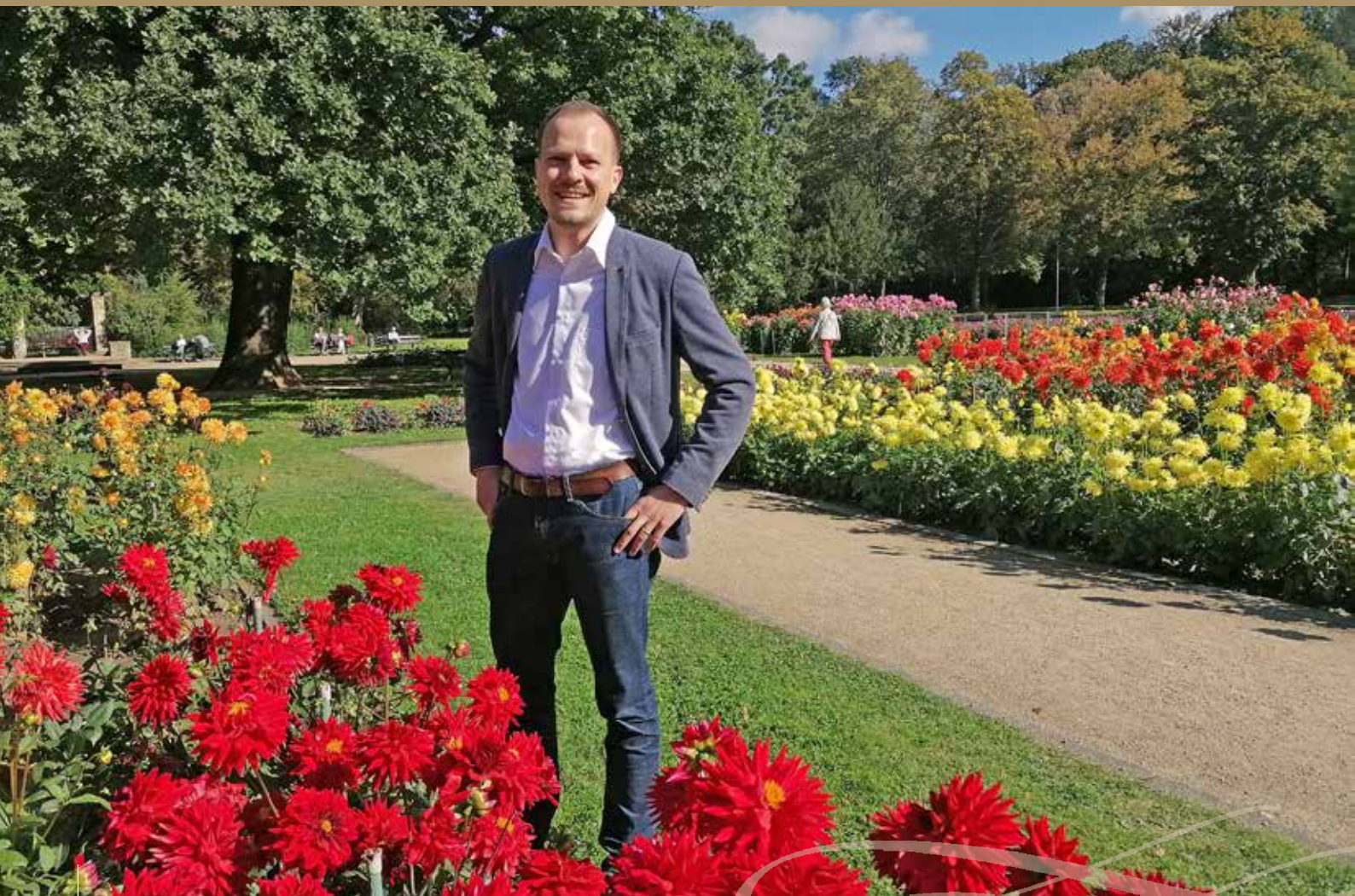
Der neue „Gartendirektor“ inmitten des reich blühenden Dahliengartens im Großen Garten Dresden im Herbst 2021