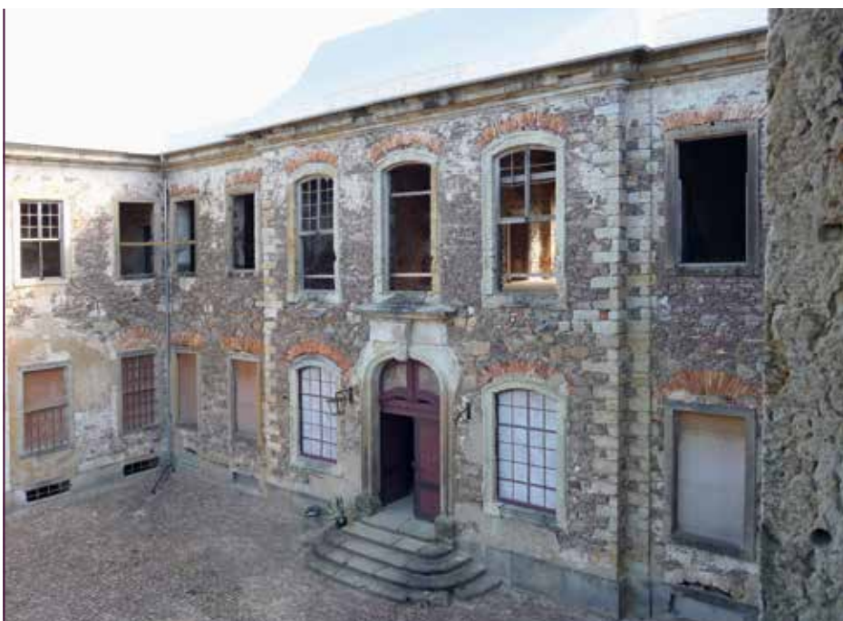
Schloss Dahlen, Zustand vor der Notsicherung, 2010

Bemerkenswert ist, dass alle diese Baumaßnahmen in Eigenregie des Schloss- und Parkvereins durchgeführt werden. Lediglich am Nebengebäude wurde die Unterstützung eines Planungsbüros in Anspruch genommen. Der Verein stellt die Fördermittelanträge, vergibt die Leistungen und rechnet die Vorhaben ab. Die Bausumme der Jahre 2019 bis 2021 betrug über 350.000 Euro! In diesem Tempo geht