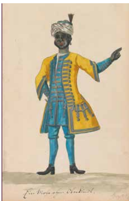
Kleidung der 21 „Mohren“, die 1719 zur Hochzeit des Kurprinzen auftraten