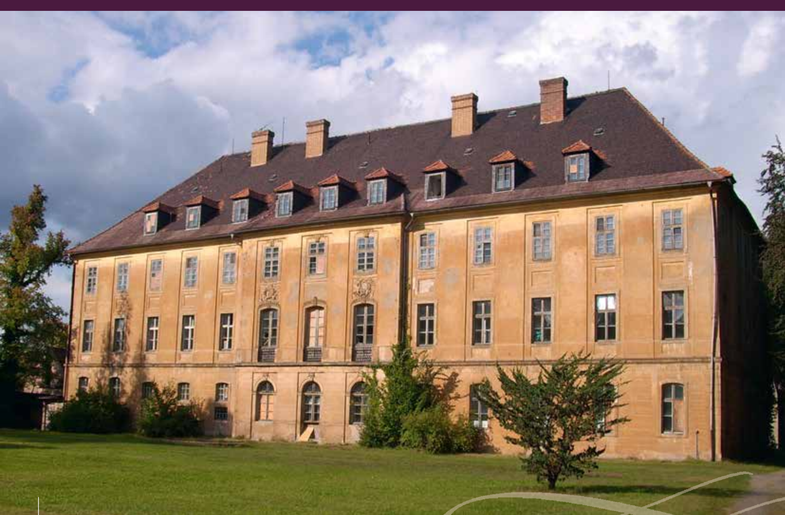
Schloss Uhyst/Spree in der nördlichen Oberlausitz steht seit vielen Jahren leer