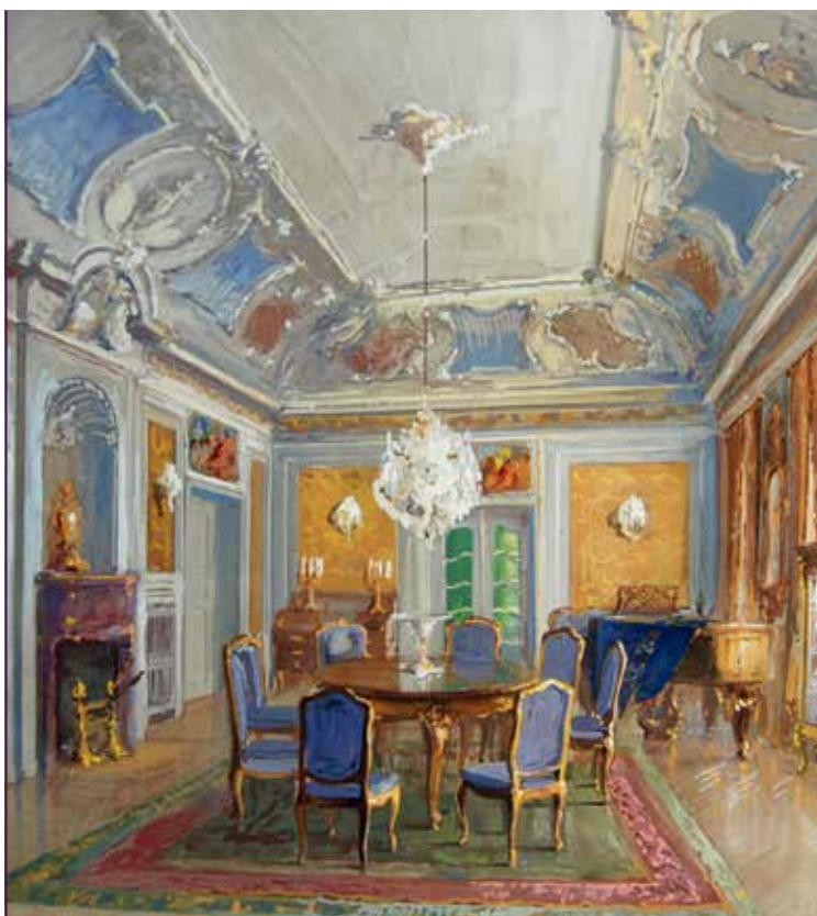
Entwurf von Max Herfurt zur Neugestaltung des Salons im Schloss Weesenstein, um 1919