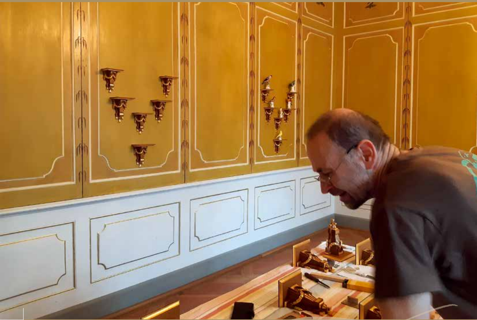
Anbringung der Konsolen im Vogelzimmer des Schlosses Rammenau, Dezember 2021