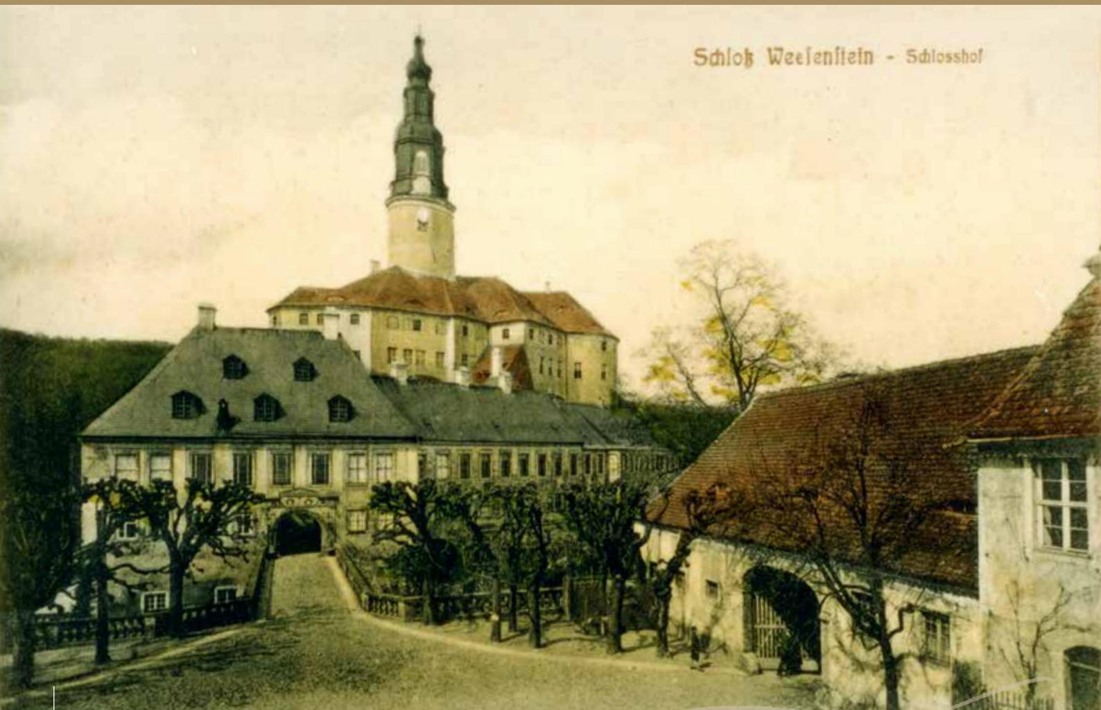
Schloss Weesenstein, Postkarte, um 1920