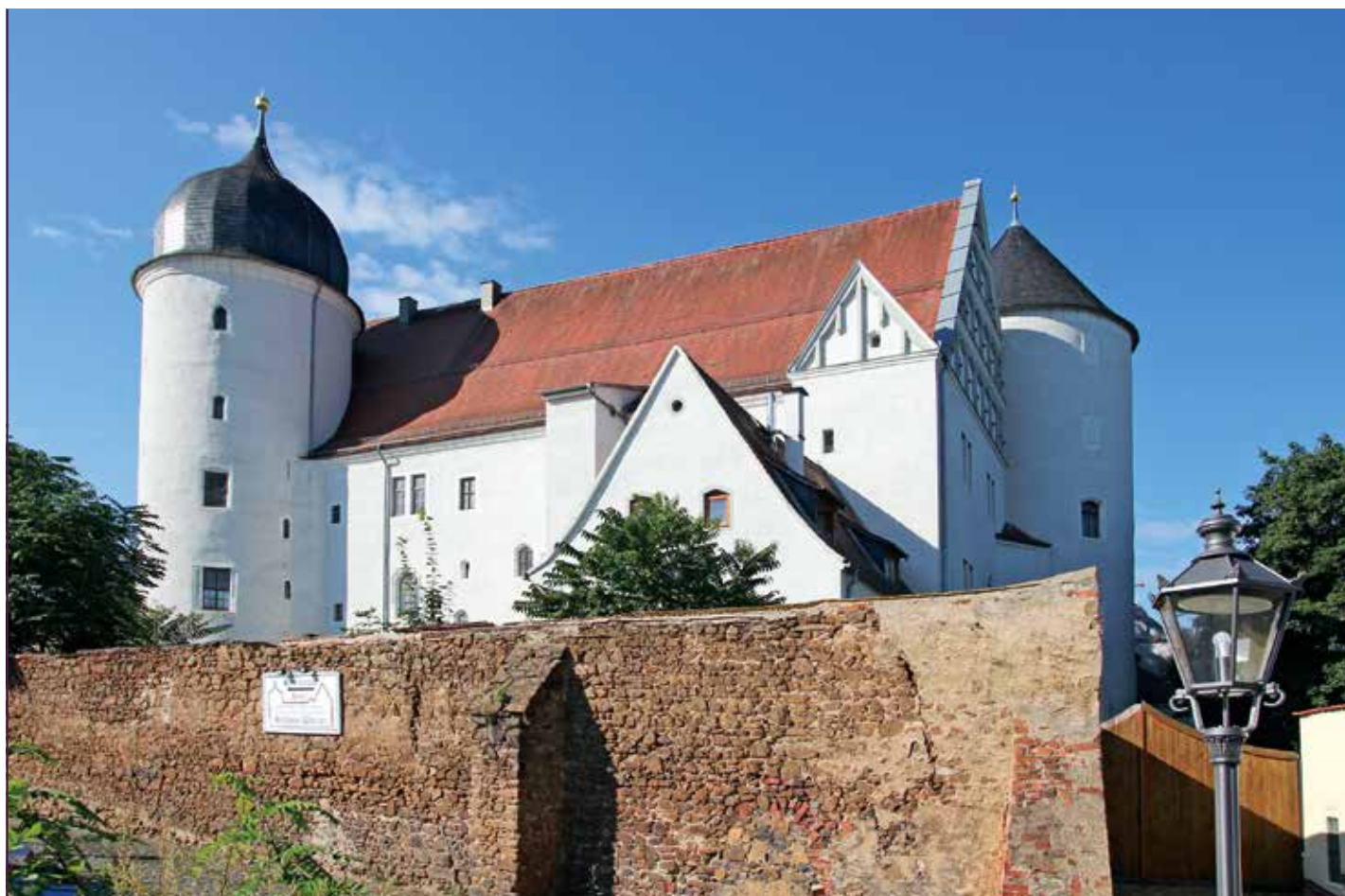
Das frühere Schloss der Bischöfe von Meißen in Wurzen ist heute Schlosshotel.